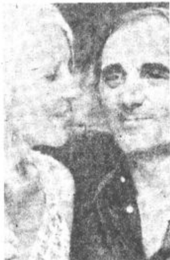
Charles Anznavour z ženo Ullo

– Spoznal sem, da ne delajo napak samo ženske ampak tudi moški. V prvem zakonu sem popolnoma izgubil živce, v drugem že manj, v tretjem zakonu pa nisem imel nobenih težav. Spoznal sem, da je življenje kratko in da si ga ne smemo greniti s težavami.