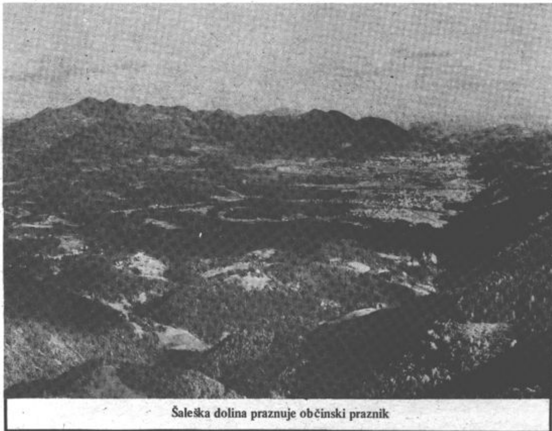
Šaleška dolina praznuje občinski praznik

Glavni in odgovorni urednik Ljuban Naraks