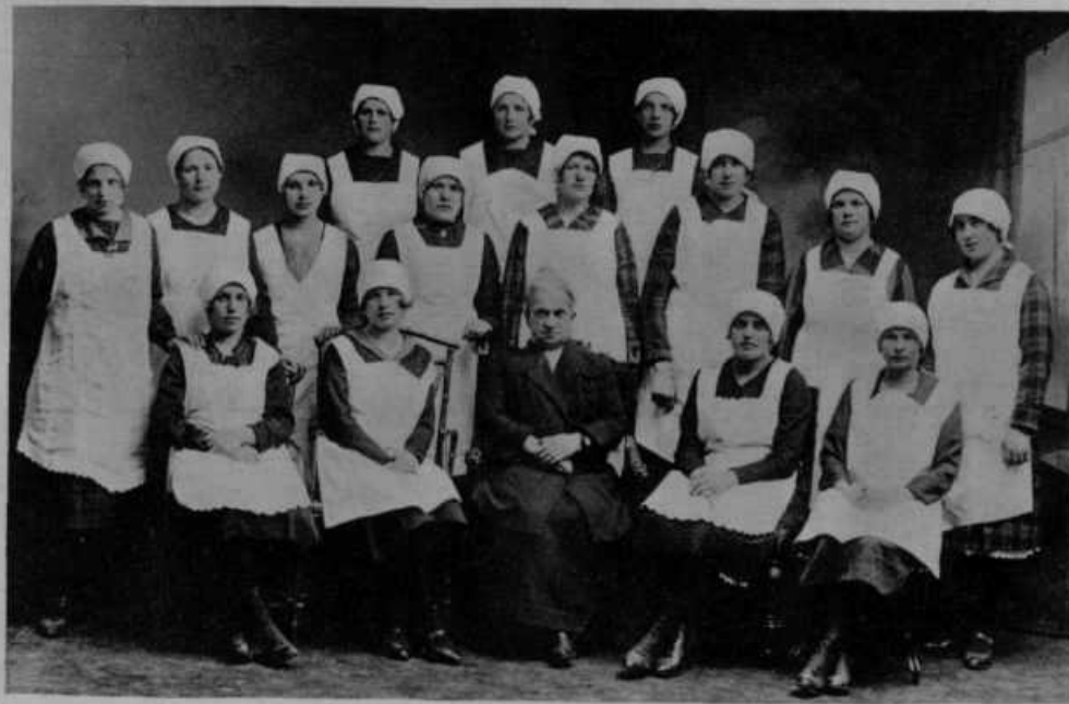
Udeleženske gospodinskega tečaja v Preddvoru pri Kranju od 10. januarja do 20. marca t. l.