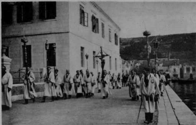
Procesija „za križem“ na veliki petek na dalmatinskem otoku Hvaru. Vsaka župnija ima svojo procesijo, ki gre opolnoči z doma ter obišče vseh šest župnih cerkva na otoku. Vrne se ob sedmih zjutraj. Procesijo vodi bratovščina sv. Rešnjega Telesa. Člani so v belih srednjeveških tunikah. Nosilec križa in mnogi verniki gredo v procesiji bosí iz pobožnosti ali zaobljube. Globoka je vernost dalmatinskih otočanov.