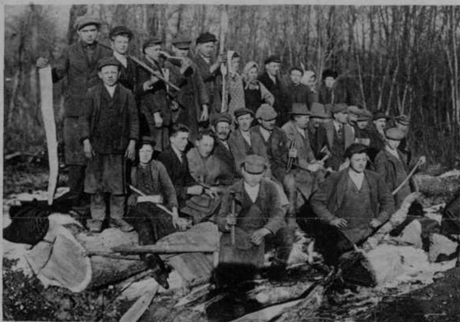
Prebivalci v vasi Krapje v ljubomerskem okraju se sami rešujejo pred povodnijo reke Mure. Napravili so nasipe, ki so jih morali v preteklem letu trikrat popravljati, tako je Mura divjala. — Slika nam kaže ljudi, ki so zbrani, da naredijo 80 m dolg in 5 m visok jez preko Mure. Upajmo, da bo sedaj za uravnavanje naših najbolj divjih rek priskočila na pomoč tudi država.