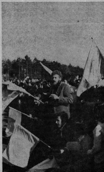
Navijanje, zastave, živci — presneti nogomet

(Hvala nogometašem. Zaradi vsega in predvsem zaradi premirja na terenu v obliki 1:1, pa naj so ga dosegli hote ali nehote. Čudovito bi bilo, če bi to kakorkoli storil tudi del navijačev. Ne le ljubenskih, sicer obsojenih za vse kar je v navljanju slabega, tudi domačih, ki so jim bili tokrat in že prej, najmanj enakovredni, čeprav tega še danes nočejo vedeti. Že kar nerazumljivih in ljudi nedostojnih neslanosti je bilo tokrat preveč, nikomur in najmanj nogometu v korist.)