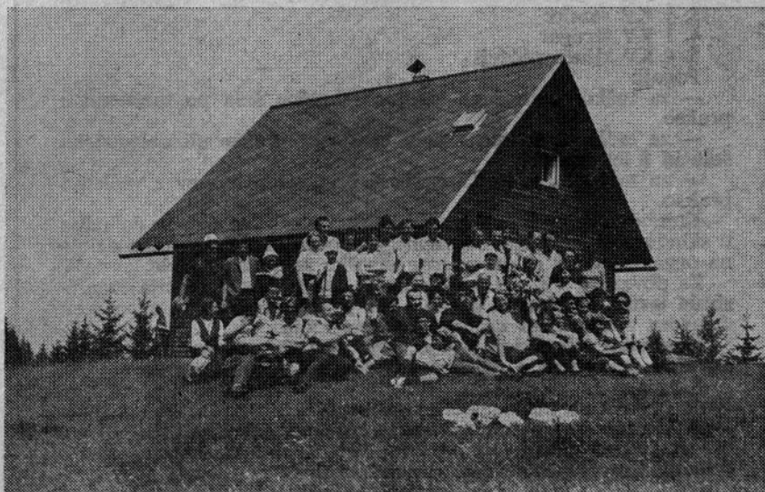
Mozirski planinci pri slovenski planinski koči na Bleščeči planini

Okupator je uničil planinstvo, ko je bilo v največjem razcvetu, premoženje zagel, postojanke zažgal. Po osvoboditvi se je delo nadaljevalo. Vse razdejane ni povzročilo malodušja med planinskimi delavci, nasprotno, delovni polet je zavzel tak obseg, kot ga ne pomnimo. 1948 je bilo v Mozirju ustanovljeno Planinsko društvo, ki goji in nadaljuje tradicije SP SPD; moralo pa se je delno odtrgati iz svoje nekdanje superromantike in idile ter upoštevati nova, sodobna dejstva in življenjske navade. Opravljenega pa je bilo veliko: Planinsko društvo Mozirje skrbi danes za 14 planinskih poti na področju Mozirske planine. Markacijski odsek sestavljajo štirje člani, ki skrbe ne le za markacije, temveč tudi za čiščenje poti. Opuščena je bila v tem času le pot Paška vas-Mozirska koč na Golteh. Opravljeno je bilo nad 150 pregledov, popravil, napisnih tabel ipd.