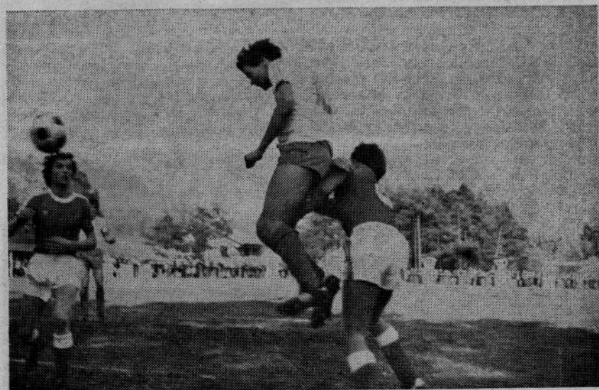
Tale strel je domačinom vzel sapo, a so jo do konca tekme le dobili nazaj

Razpis velja do zasedbe delovnega mesta.