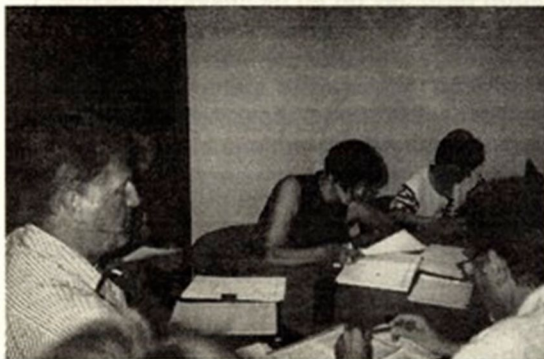
S tiskovne konference o cesti

Tega odseka ni mogoče graditi brez prostorskega ureditvenega načrta. Če pa želimo cesto umestiti v prostorski načrt, potrebujemo soglasje ministrstva za okolje in prostor. Naša dosedanja prizadevanja, da bi to soglasje dobili, niso rodila sadu.«