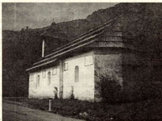
Cerkev v Ribjeku obnavljajo.