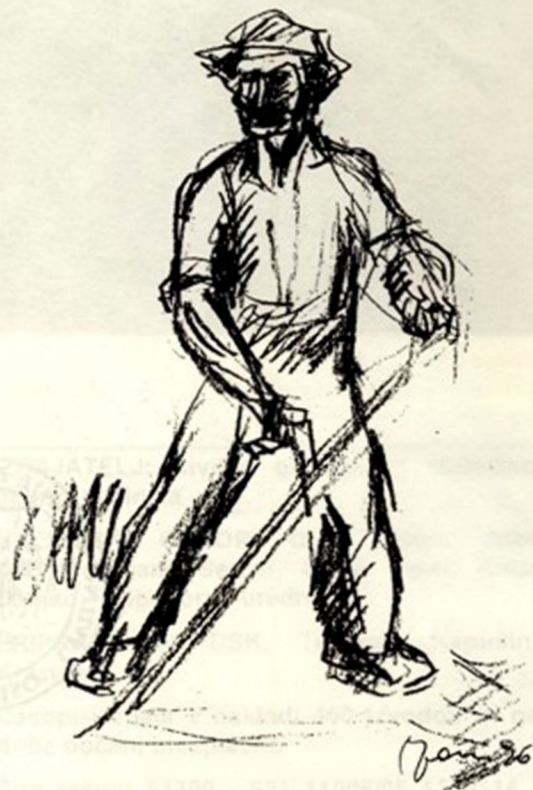
Stane Jarm: Kosec