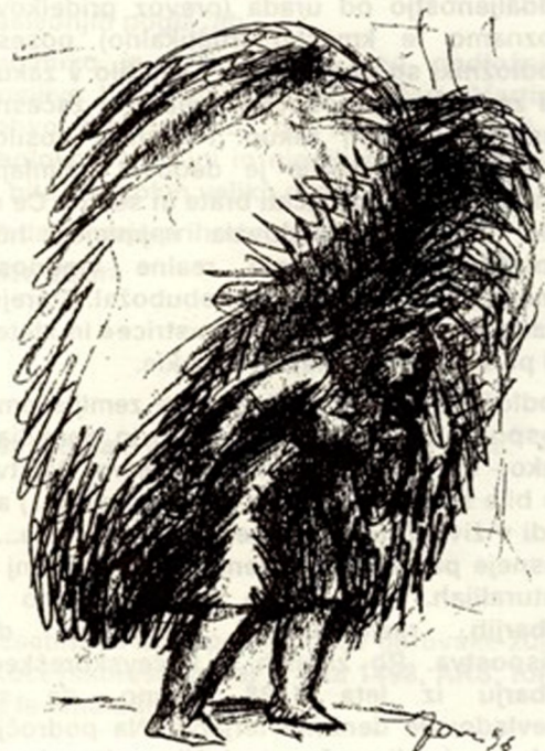
Stane Jarm: Butara

Po pripovedi Danice Švab zapisala Olga Lenac