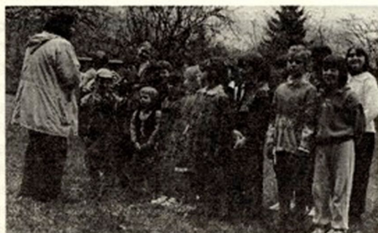
Otroci vedno popestre naše praznike