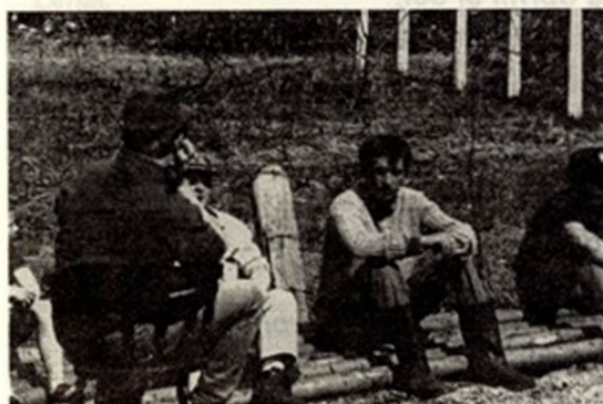
Ob Lovskem domu v Ribjeku