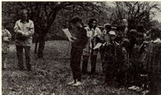
Prvi maj, naš občinski praznik na Hruški ograji