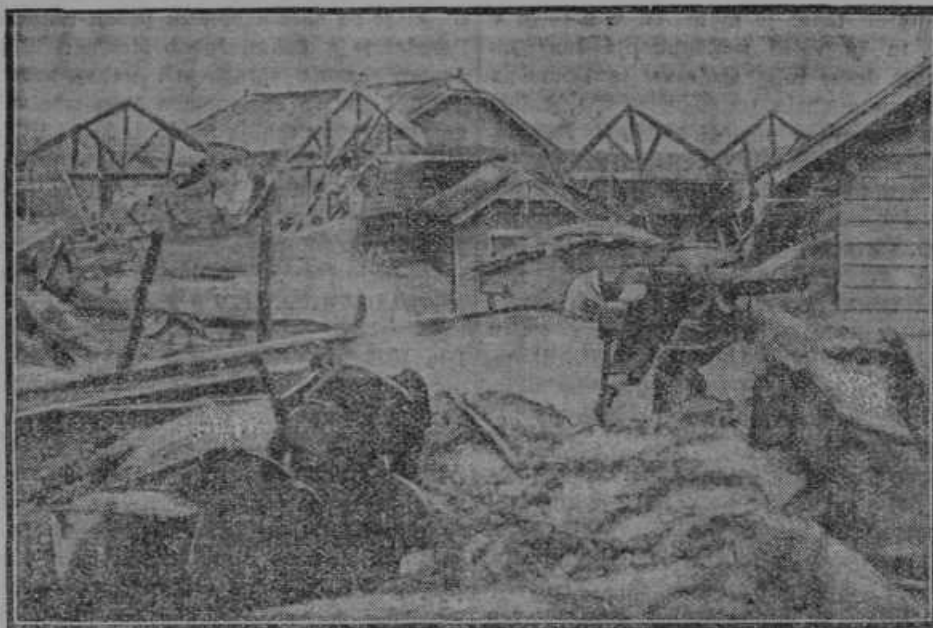
Po potresu na Japonskem.

vodil 25 let. Še večje so njegove zasluge na združnem polju. 32 let že vodi vzgledno našo posojilnico, ki je postala v njegovih rokah krepek denarni zavod. Ko se je pri nas ustanovilo pred 34 leti katoliško bralno in gospodarsko društvo, mu je bil Zupe dolga leta podpredsednik. 30 let je sodeloval v lenarškem okrajnem zastopu kot odbornik in ravno toliko let kot član načelstva okrajne hranilnice. 14 let je županoval na splošno zadovoljnost benediški občini in je še sedaj njen delavni in modri odbornik. Dolgo let je tudi ud krajevnega šolskega odbora. Svojih 7 otrok je vzgojil v pravem krščanskem in slovenskem duhu in jim je najboljši oče. Njegova hiša je med najzavednejšimi v celi župniji. Znan je oče Zupe tudi vsepovsod kot odločen katoličan, ki vzorno izpolnjuje svoje verske dolžnosti, je tudi član moške Marijine družbe in redno vsak dan prihaja k sv. maši. S svojo odločno in prepričevalno besedo je že mnogim pokazal pravo pot. On je vzor pravega slovenskega rodoljuba in jugoslovanskega državljana. Vsi ga spoštujemo in ljubimo zavoljo njegove skromnosti in dobrosrčnosti ter vsestranske delavnosti. V zadnjem času je postal tudi predsednik župniškega odbora Katoliške akcije. Ker je še čvrst korenjak, upamo, da še bo veliko dobrega storil. Naj ga Bog ohrani Cerkvi in domovini še premnoga leta! Naj najde vsepovsod mnogo posnemovalcev!