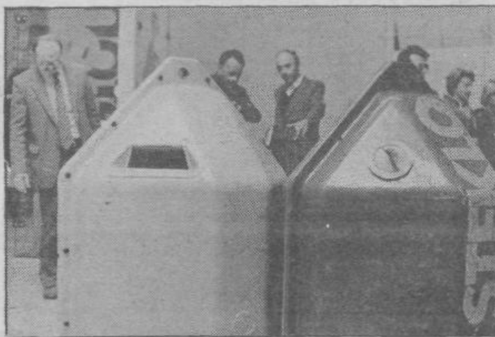
Zbiralka za papir in steklo