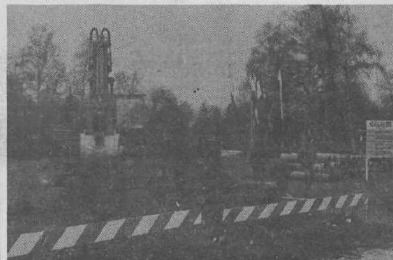
Prišli so delavci s stroji in zasadili prvo lopato (v resnici zajemalko bagra) v zemljo za Moderno galerijo. Torej se je začelo...