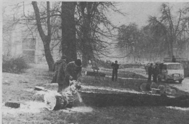
Za tem, že v letošnjem letu, pa so se pričela dela na drugem koncu trase, ob letnem telovadišču, kjer je padel del ljubljanskih »zelenih pljuč«, kar pa je bilo seveda nujno, ker drevesa, žal, sredi ceste le ne morejo ostati.