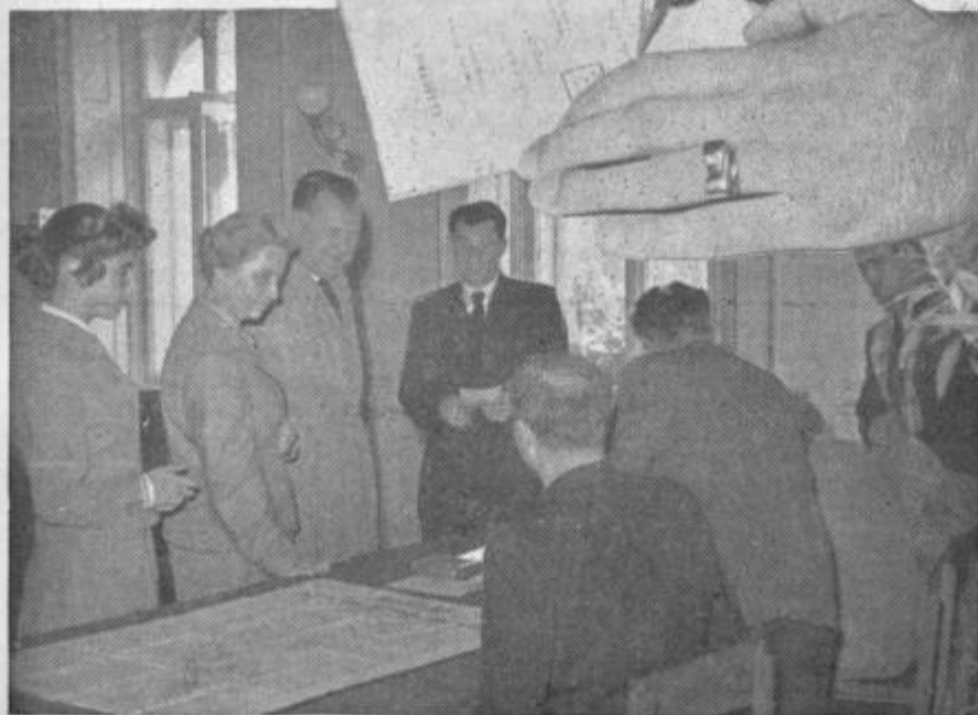
V mestu in na podeželju, povsod so že zgodaj zjutraj ljudje šli na volišča. Tale prizor je naš reporter posnel na prvi volilni enoti v Celju.

Odstotek žena, ki so v nedeljo volile znaša 53,9%. Res je, da je v okraju več ženskih volilnih upravičencev, toda ta odstotek pove mimo tega še nekaj drugega. Žene so, lahko rečemo, stoodstovno