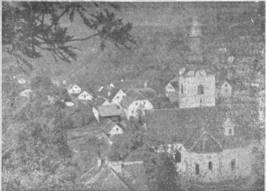
Prijazen, predvsem pa znamenit je trg Pištanj na skalnatih rebrih nad prepadno sotesko...

Je že tako na tem okroglem svetu, da ni vse, kar je največje, tudi najstarejše. Zgodovina je muhasta in včasih ne vemo, če ni celo krivična. Le pogledimo, kako je s to rečjo. Celjani se z mestnimi pravci ponašamo dlje časa, kot New Yorčani s prvo izseljeniško kolibo. In danes... Tam 10 milijonov ljudi, tu v belem Celju trideset tisoč. Pa vendar ima Celje starejšega konkurenta v vrsti srednjeveških trgov. To je Pištanj na Kozjanskem. Sicer je Celje kot Celeia in keitska naselbina slovelo že poprej, toda po preseljevanju narodov je domala izginilo, medtem pa je v središču kozjanskih pragozdov zrasklo srednjeveško naselje Pištanj, med gradoma Pailenstein in Hartenstein. Ta kraj je imel trške pravice v zgodnjem srednjem veku. Če lahko verjamemo pripovedovanju o slovenski plemkinji Hemi, ženi mejnega grofa Wilhelma v Celju, ki je začel graditi začetke celjskega gradu, se je le-ta,