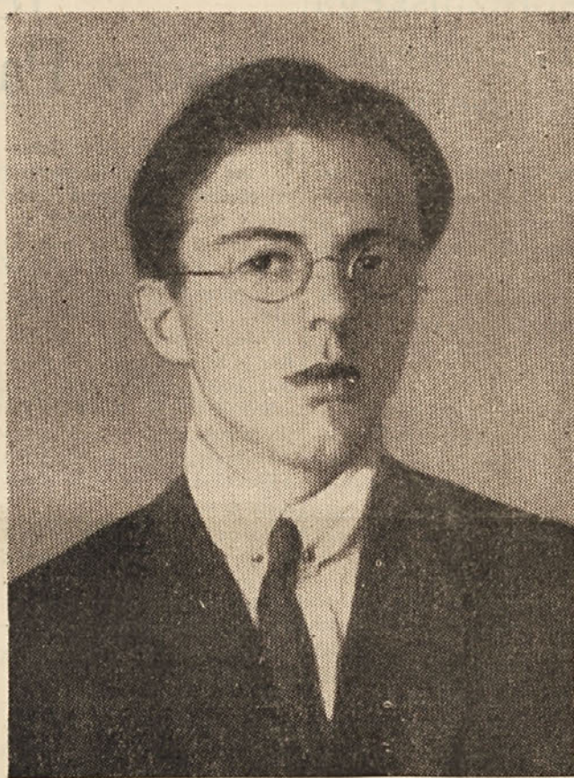
18. marca 1904 se je rodil v Sežani Srečko Kosovel, pesnik Krasa in njegove trpkosti lepote.