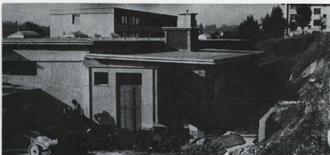
Lani decembra je v Novem mestu začela obratovati težko pričakovana energetska postaja, v kateri so nova transformatorska postaja, elektro agregat in v prizidku prostor za skladiščenje vnetljivih tekočin.

Med razpravo smo poskušali v TOZD uskladiti osnovna stališča za urejanje posameznih področij. Usklajevanje osnovnih stališč je potekalo običajno