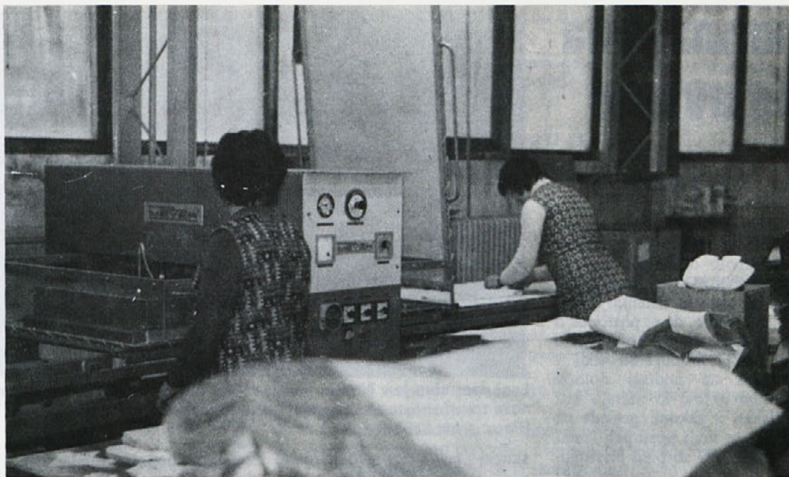
Delavki ob stroju za lepljenje podloge pri moškem programu v TOZD Temenica.

S pomočjo te majhne elektronske naprave, ki ji v TOZD Ločna pravijo KRIČAČ, so pri individualnem usposabljanju dosegli izredne rezultate. Posamezne delavke so svoj učinek povečale tudi do 40 odstotkov. O konkretnih rezultatih bodo, upajmo, strokovnjaki iz Ločne napisali kaj več v naslednji številki.