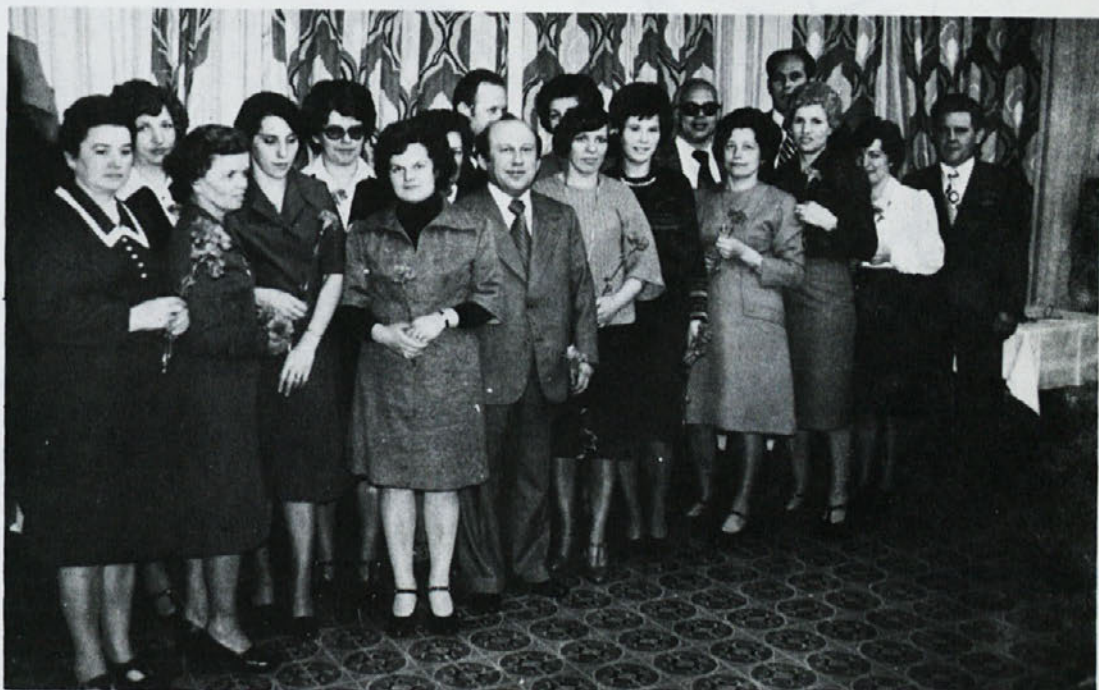
Kot leta nazaj so tudi letos delavci TOZD Ločna in delovne skupnosti skupnih služb počastili 8. marec s prireditvijo v Domu kulture v Novem mestu. Ob tej priliki so bila podeljena tudi priznanja delavcem za 10, 20 in 30 letno delo v podjetju.

Analiza polletnega poslovanja je pokazala resnično sliko glede na uresničevanje planskih