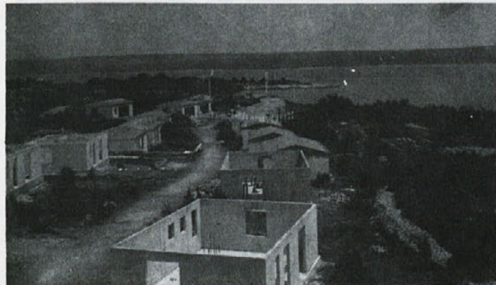
Lani smo dobili nove počitniške kapacitete tudi na Lošinjju. Tako bomo letos imeli v okviru počitniške skupnosti sedem počitniških hišic, v katerih želimo, da bi se najbolje počutili.

Na podlagi 94. člena samoupravnega sporazuma o osnovah za uporabo sredstev skupne porabe in urejanju stanovanjskih razmerij