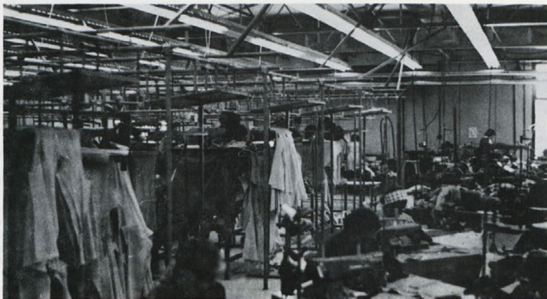
V šivalnici TOZD Delta Ptuj so doslej edini v tovarni oblačil organizirali šivanje po tako imenovanem visečem sistemu.