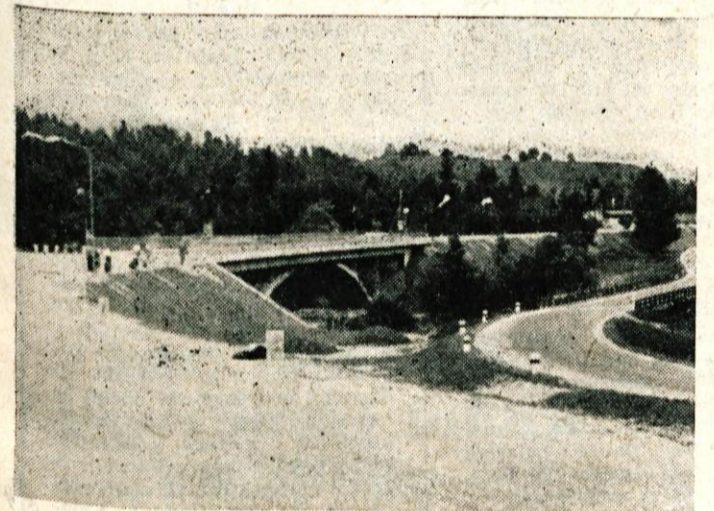
Pogled na novi (levo) in stari most (desno)