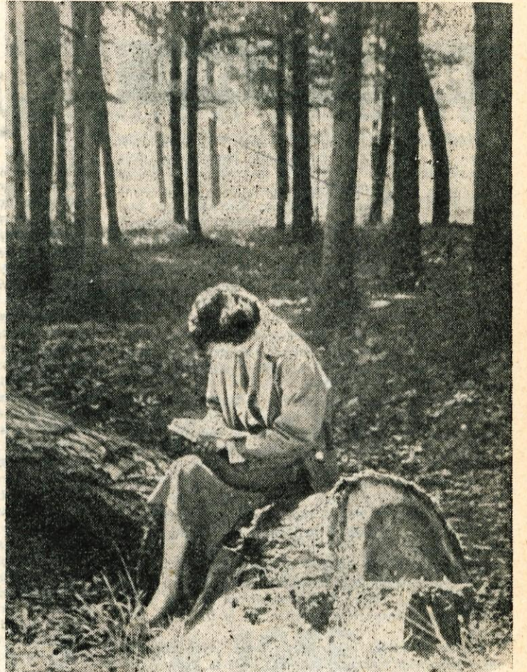
V toplih majskih dneh je tudi učenje v naravi velik užitek

došel vsem manjšim podjetjem, ki sama nimajo ustreznega strokovnega kadra, ki bi delal take ekonomske analize in dokumentacije. Prav zaradi pomanjkanja takšnega kadra podjetja nimajo pravočasno izdelanih investicijskih programov in zaradi tega ne morejo sodelovati na natečajih za kredite. Odločitve za ustanovitev biroja še ni. Sedaj čakamo, če se bodo vse zbornice zedinile za ustanovitev takega biroja.