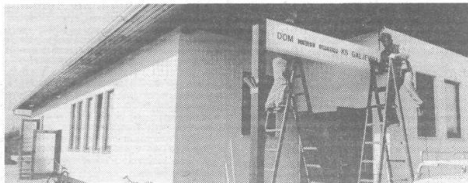
Prej je bila kot vsaka druga montažna hiša, zdej, z napisom, pa je postala tudi uradno dom krajanov KS Galjevica. In to je res njihov dom, saj so ga zgradili z lastnim delom in le z nekaj pomoči iz občinskega žaklja.