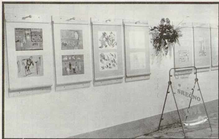
Razstava — OŠ Majšperk