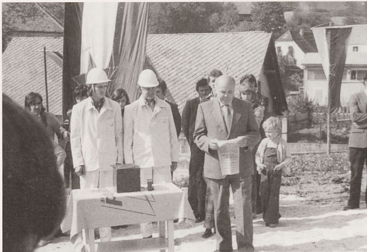
Polaganje temeljnega kamna za novo samopostrežno trgovino. Vitanje, oktober 1977, foto: Duša Krnel Umek.

razumevanje kulture (ali kultur), pri čemer je poleg subjekta vključen tudi fotograf. Na vprašanje, kaj opredeli fotografijo kot etnografsko, odgovarja, da je bistveno, kako je uporabljena in predvsem da gledalca etnografsko informira. Raziskovalna metodologija za uporabo etnografske fotografije v antropoloških raziskavah vključuje naslednje prijeme: