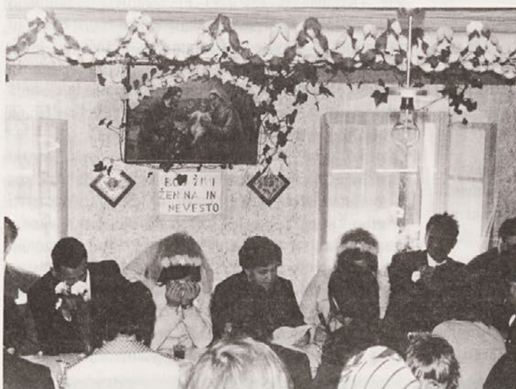
Ko teta bere slovo, svatje jokajo. Hudinja, april 1975, foto: Zora Pavlin.