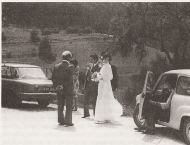
Prihod neveste. Vitanje, julij 1977.