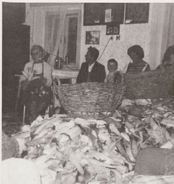
"Kožuhanje" v Ljubnici pri Vitanju. Oktober 1975, foto: Zmago Šmitek.