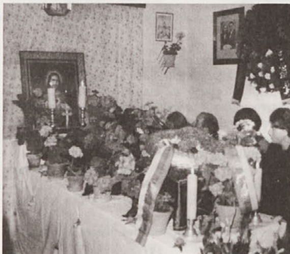
Mrtvaški oder v hiši. Julij 1977, foto: Borut Kríž.

V Enciklopediji kulturne antropologije (926 -927), kjer je fotografija predstavljena z vidika fotografske komunikacije, je označena kot etnografski dokument, ki jo odlikuje pridobivanje kompletnih in natančnih slikovnih zapisov, npr. o tem, kako določena skupina ljudi živi, da so bili fotografi med to skupino in so to, kar so fotografirali oziroma kar prikazujejo fotografije, tudi sami videli. Bolj precizno definicijo navaja J. C. Scherer (1992, 34; 1995, 201), ki označi fotografijo kot etnografsko, kadar jo uporabljamo za zapis kulture in