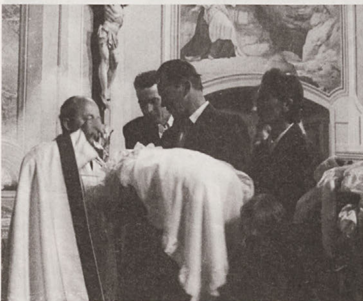
Krstni obred. Vitanje julij 1977, foto: Jože Hudales.