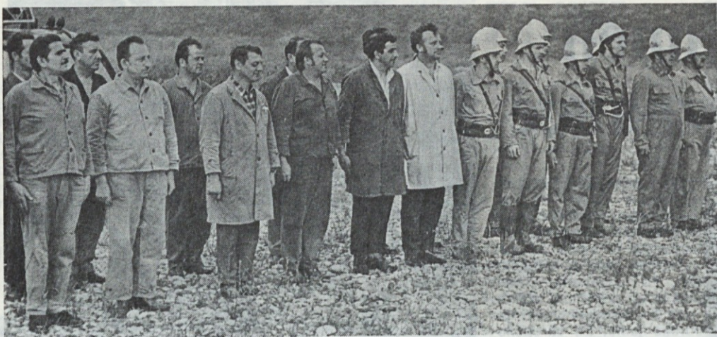
Člani civilne zaščite in vod gasilcev v pozdravu ob raportu glavnemu direktorju po končani skupni vaji, o kateri se je pohvalno izrazil