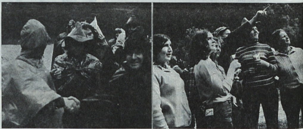
Na začetku dež, na koncu sonce. Iz doline smo se ozrli proti Grintavcu, katerega nam je dež dva dni zakrival in onemogočil množični vzpon