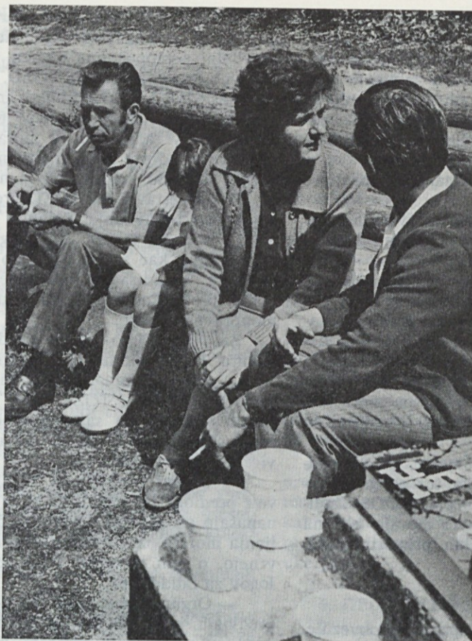
Sproščn klepet borcev v tišini prostranih gozdov Jelovice

Tudi družbenopolitične organizacije našega kolektiva so letos, kakor vsako leto doslej, priredile v počastitev