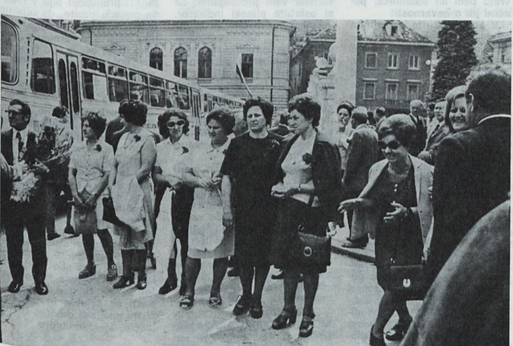
Med gosti iz naši sorodne tovarne embalaže so bili predstavniki samoupravnega in družbenopolitičnega življenja, vodje oddelkov, predvsem pa je bilo največ delavk in delavcev iz sredne proizvodnje. Z njimi je bilo prijetno kramljati in dan je bil za srečanje kar prekratek. Ugotovili smo, da nam življenje in delo zelo podobno tečeta.