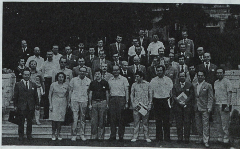
Udeleženci mednarodnega simpozija o avtoelektrični opremi.