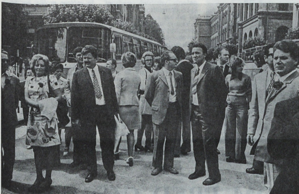
Letos smo goste počakali na Kongresnem trgu, kamor so se pripeljali z avtobusi.