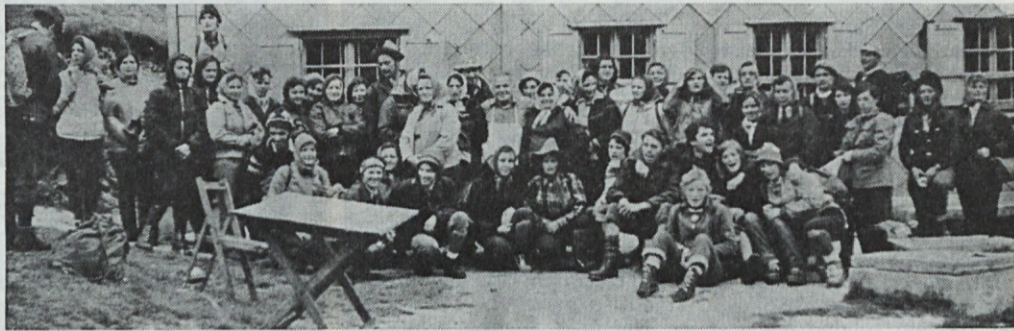
Namesto 90, nas je bilo na Kokrškem sedlu 62 udeležencev. Kriv je neizprosno vztrajen dež

Zahvaljujemo se delovnemu kolektivu »ZMAJ«, ki nam je za to akcijo daroval 10 kompletnih žepnih svetilk, ki jih bomo s pridom uporabljali na gorskih poteh. »ZMAJ« je doslej prvi zunanji kolektiv, ki nam je materialno pomagal.