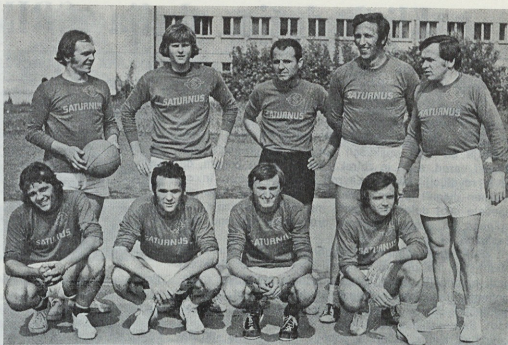
Ekipa košarkarjev — dve generaciji