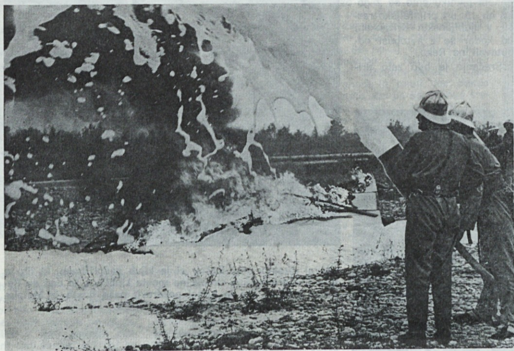
Gašenje s peno, ki je najbolj učinkovito za vnetljiva sredstva, kakršna uporabljamo v naši proizvodnji

Šestega junija letos smo po odobritvi odbora za splošni ljudski odpor podjetja izvedli skupno vajo članov gasilne enote civilne zaščite in industrijskega gasilnega društva »Saturnus« Ljubljana. Vajo na požarnih mestih na dvorišču obrata so izvajali člani civilne zaščite z ročnimi gasilnimi aparati in meserjem. Desetina gasilnega društva pa je na požarnem mestu na savskem prostu v Jaršah prikazala gašenje lakov in barv z meserjem in z motorno brizgalno z uporabo lahke in težke pene ter vodno meglo.