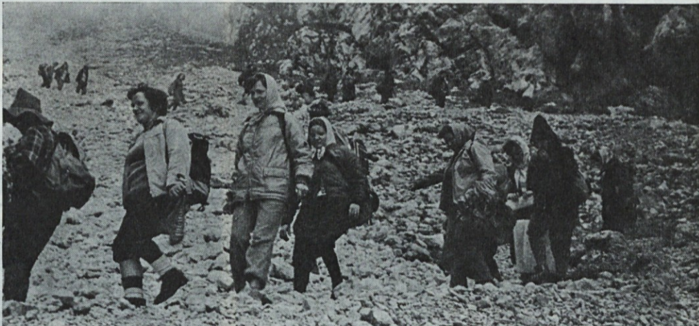
Veliko odprav je moralo že kljub velikim naporom odstopiti brez doseženega cilja. Tudi Saturnužanke se bodo morale še kdaj povzpeti po isti poti, da bodo sploh videle, kje so bile. Svoj prispevek k 80-letnici slovenskega planinstva pa so kljub temu dale