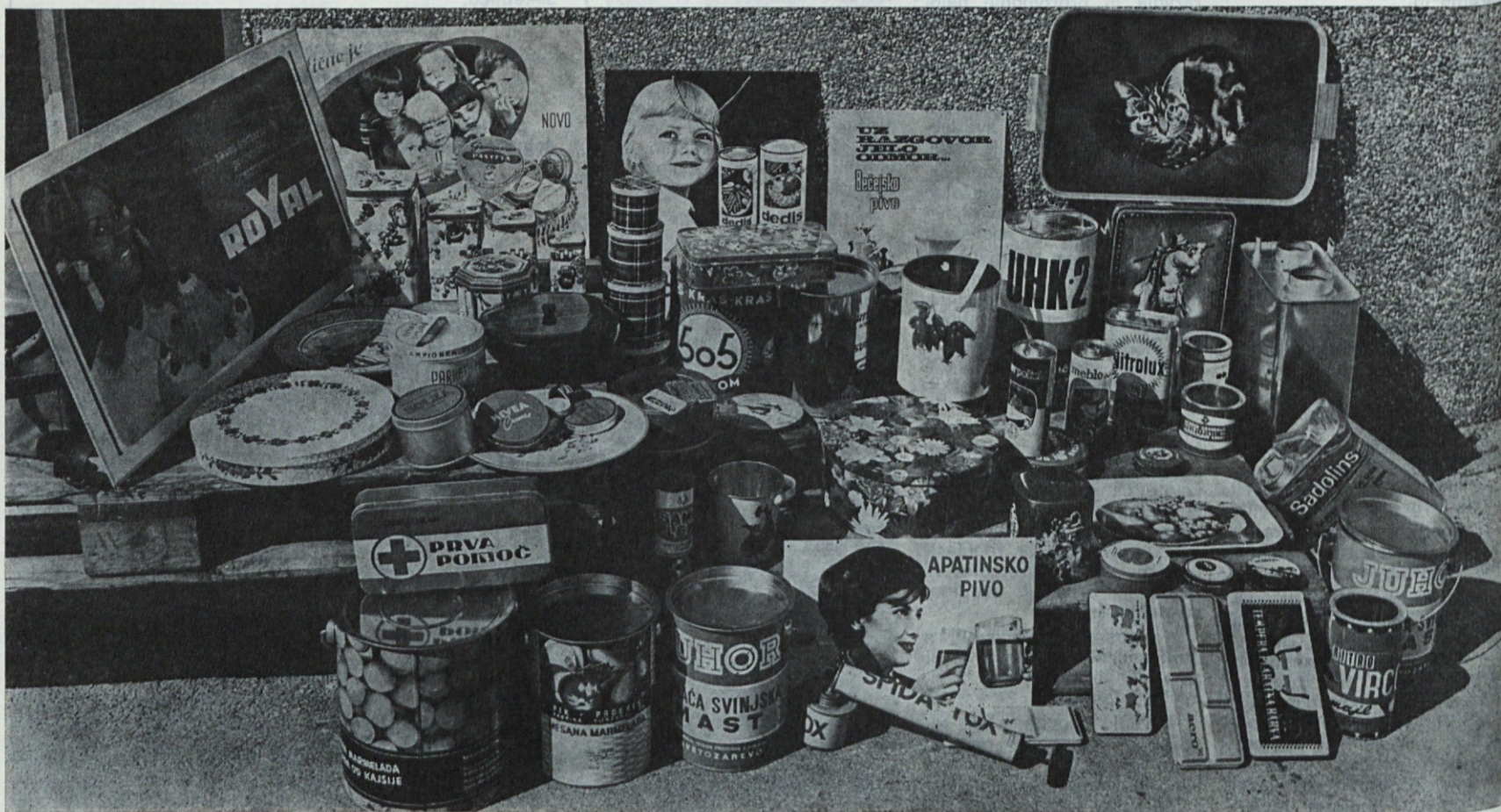
Izdelki delovne enote embalaža, ki s svojim širokim asortimanom nudijo kupcu široko izbiro in kakovost.