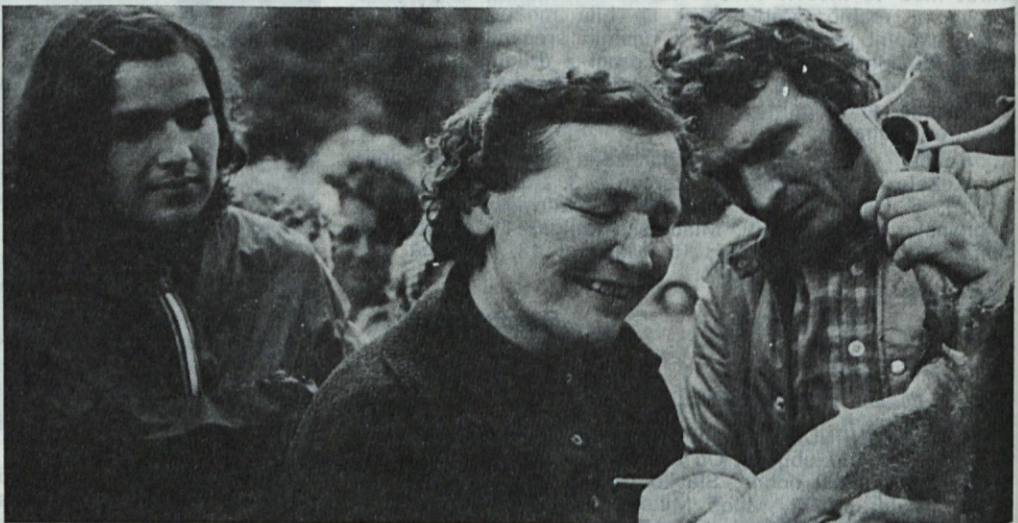
Najstarejša udeleženka Mišičeva se za spomin podpisuje na korenino bora, ki ga je nekje višje soko odtrgal hudournik. Človek in narava, ali je kaj bolj trdnega