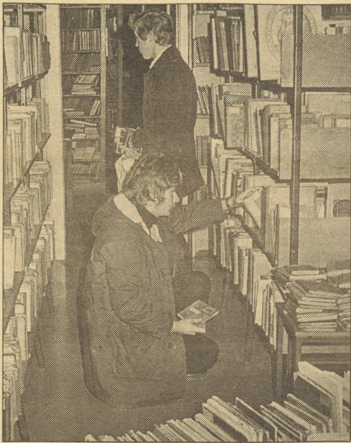
Kako spraviti knjige iz skladišč v javne knjižnice, v katerih je izvodov novih knjig vedno premalo?

ljudje že sami oglašali s predlogi, prosili za nasvete in sodelovanje. V osemnajstih letih dela se je včasih tudi kaj podprlo, kar smo dolgo s trdim delom gradili. Toda nikoli nisem bil razočaran, saj sem vedel, da bomo spet drugje pridobili nove ljudi.