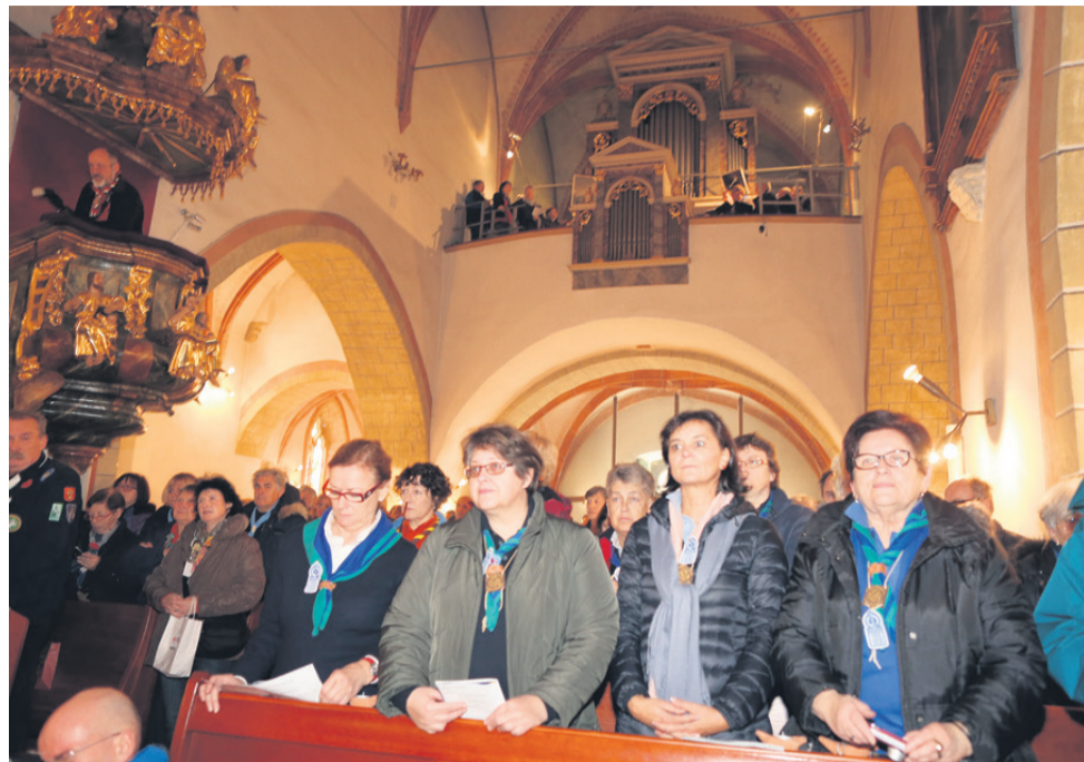
V stolnici so odrasli katoliški skavti molili v kar štirih različnih jezikih.