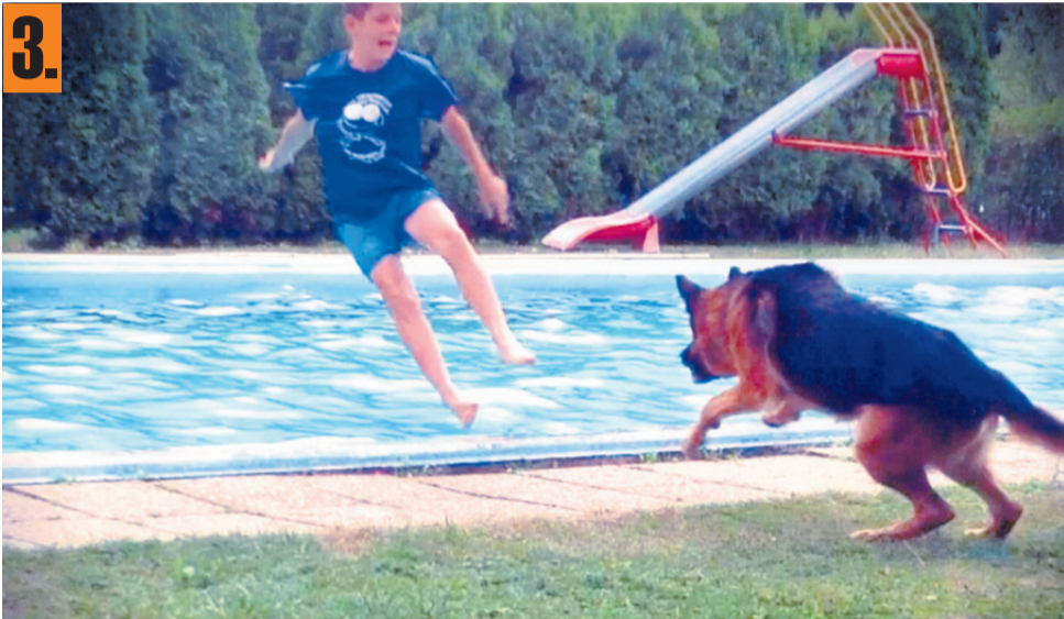
Nemški ovčar Dalas bi se tudi rad kopal.