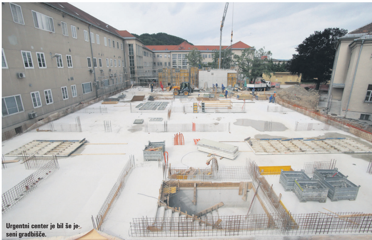
Urgentni center je bil še jeseni gradbišče.