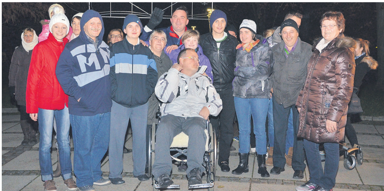
Radost in veselje na Pegazovi ploščadi.