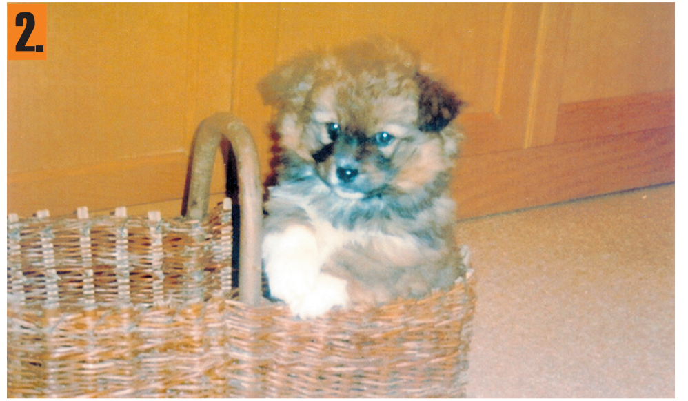
Medo je najraje v košari, le da jo je medtem verjetno že prerasel.