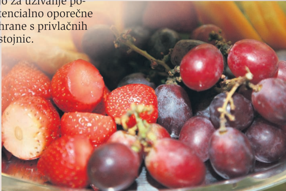
Ali sadje res vedno umijete, preden ga zaužijete?

živila nimajo enakih lastnosti. Preživetje in razmnoževanje patogenih mikroorganizmov je torej najbolj odvisno od tega, kako in kaj nekdo z živili počne. »Prihaja lahko do tako imenovanega navzkrižnega