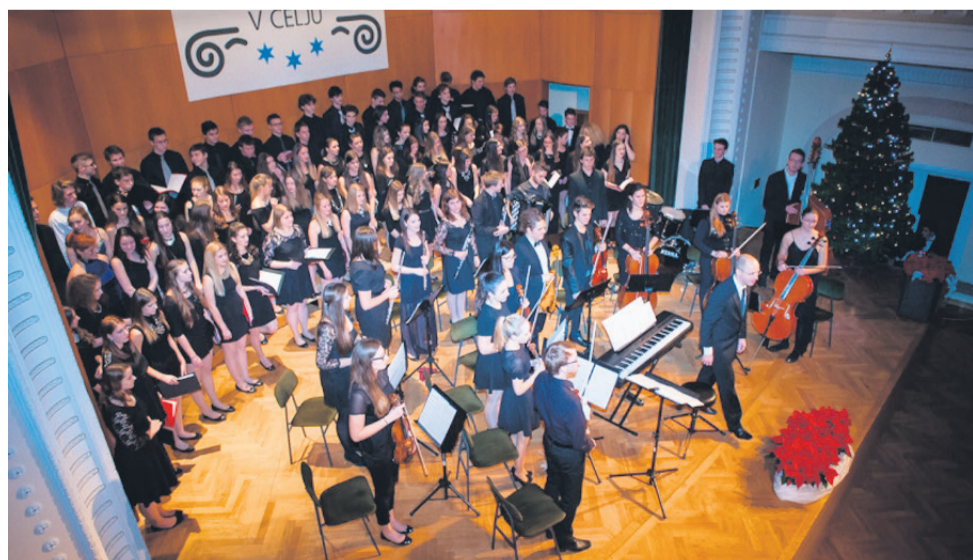
Dobrodelni tradicionalni božično-novoletni koncert Mešanega mladinskega pevskega zbora in orkestra I. Gimnazije v Celju