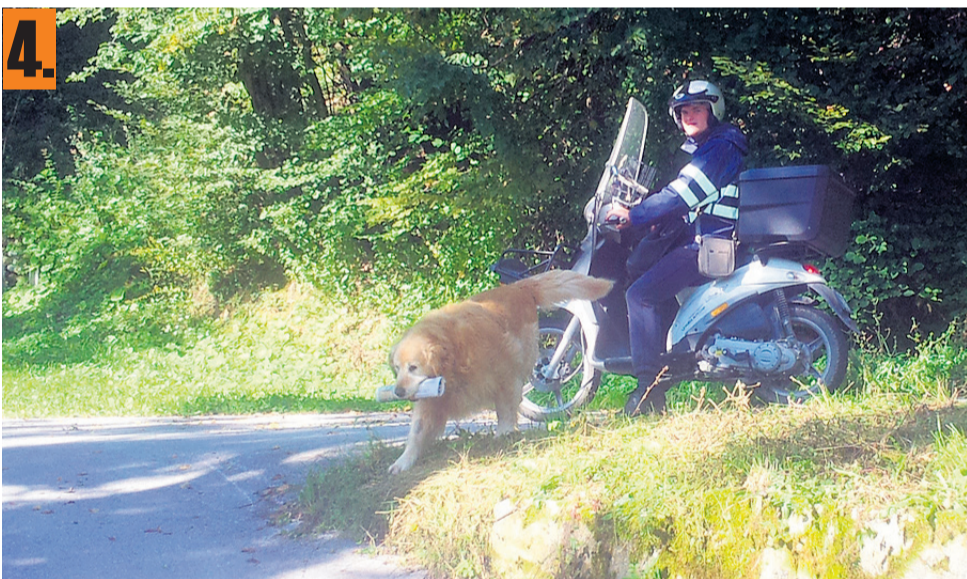
Pri Trupijevih je domači kuža poštarjev pomočnik.