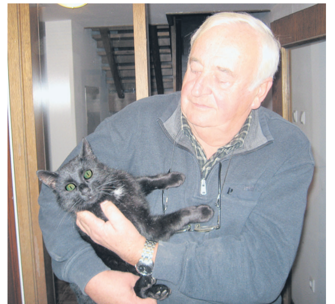
In kakšno domačo žival ima dolgoletni zdravnik malih živali na Celjskem? Njegov maček Muri je star več kot desetletje.

»To, da si skupaj z živalcami, je nekaj najlepšega. Gledajo te, verjamejo ti. Žival te oceni takoj, ali ti zaupa ali ne,« se spominja srečanj z živalmi. »Tudi če ti bolečino vrne, ji ne smeš zameriti,« omenja dolgoletni veterinar.