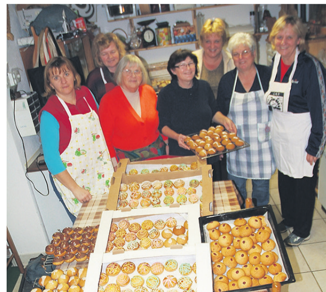
Polna miza medenjakov napoveduje praznične dni.