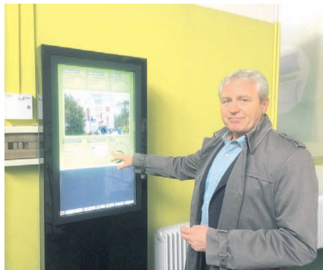
Porabo energije v Šolskem centru Velenje je mogoče spremljati tudi na digitalnih interaktivnih tablah.

Priključili smo merilne instrumente, kot so kalorimetri, števcji za električno energijo. Merimo tudi mikroklimo bivalnega ugodja in porabo pitne vode. Tako imamo pregled nad porabo katerekoli energije. Ener-