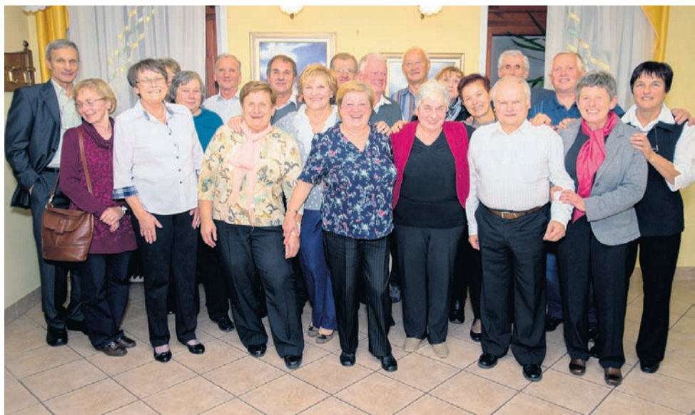
Udeleženci srečanja ob 50-letnici končanja osnovne šole na Vranskem