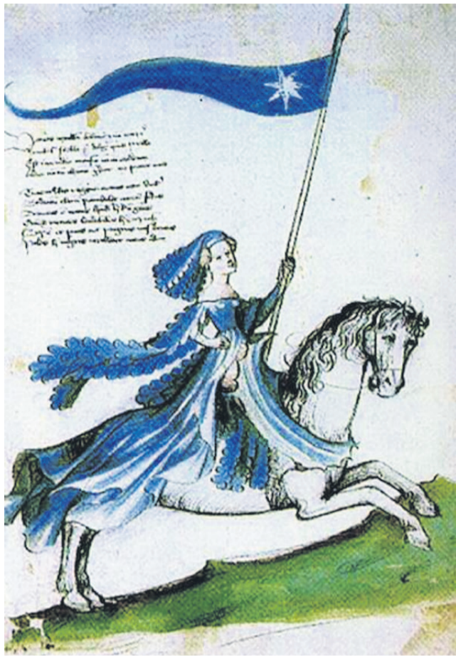
Iz uvoda v publikacijo Barbara Celjska (1392? -1451)