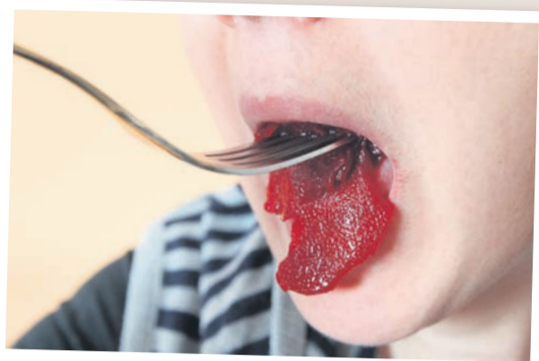
Kaj vse damo v usta, ne da bi se preprečili, ali je varno?

Zaradi zastrupitve s hrano, okužbe z bakterijami, virusi ali paraziti lahko pride do akutne driske. To se lahko zgodi doma ali tudi na potovanjih v dežele, kjer ljudje niso navajeni prehrane ali se odločijo za uživanje potencialno oporečne hrane s privlačnih stojnic.