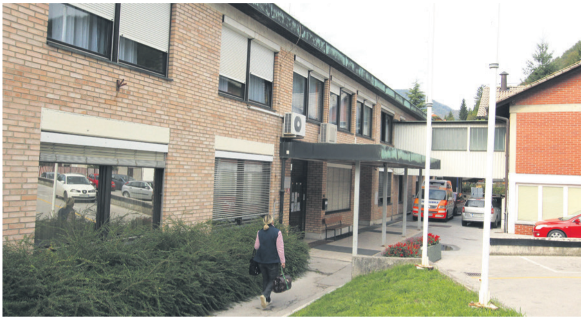
Zdravstveni dom Laško je med revizijskim postopkom sprejel ustrezne popravilne ukrepe za odpravo razkritih nepravilnosti, zato računsko sodišče ni zahtevalo odzivnega poročila.