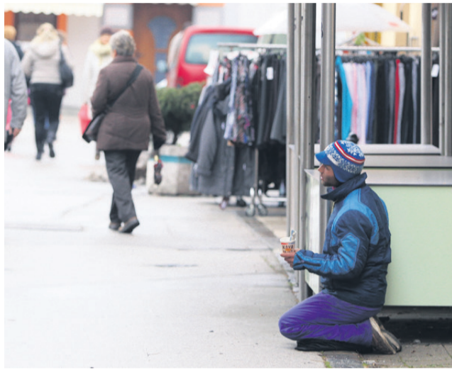
Berači, ki resnično potrebujejo denar, ali berači, ki so le žrtve dobro organizirane kriminalne mreže?