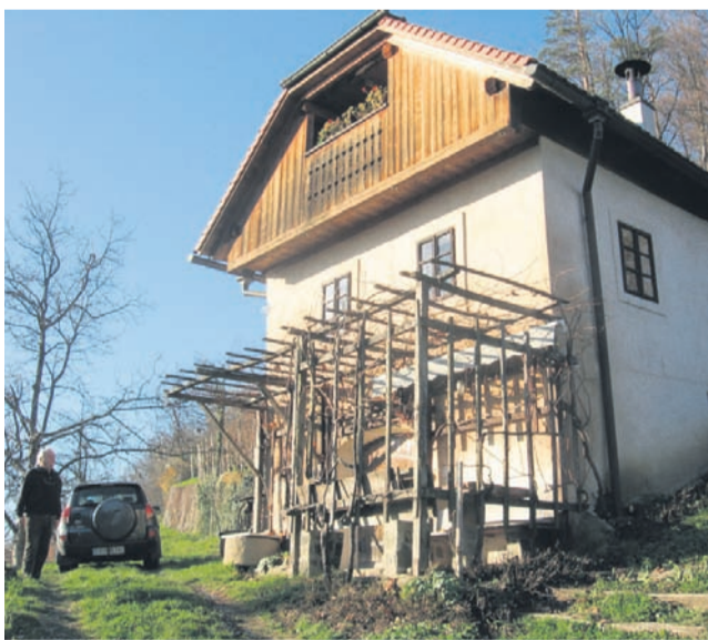
Štokojnikova zidnica v okolici Nove Cerkve, kjer so med drugim ocenjevanja salamarske sekcije. V notranjosti zgradbe se je ohranila celo črna kuhinja.

»To, da si skupaj z živalcami, je nekaj najlepšega. Gledajo te, verjamejo ti. Žival te oceni takoj, ali ti zaupa ali ne,« se spominja srečanj z živalmi. »Tudi če ti bolečino vrne, ji ne smeš zameriti,« omenja dolgoletni veterinar.