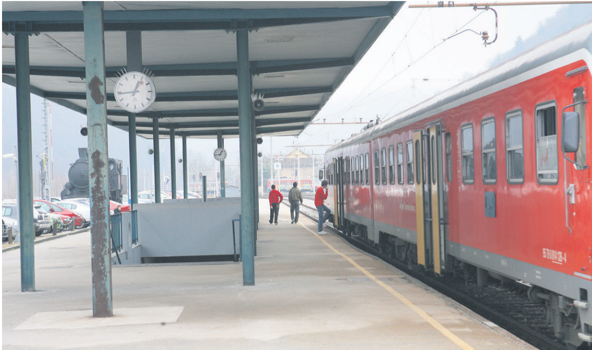
Na železniški postaji Celje. Glavno štajersko progo že posodablja. Trenutno opravljajo dela na območju Slovenske Bistrice, prihodnje leto bo na vrsti odsek Dolga Gora-Poljčane. Projekt za posodobitev med Zidanim Mostom in Celjem že pripravljajo.