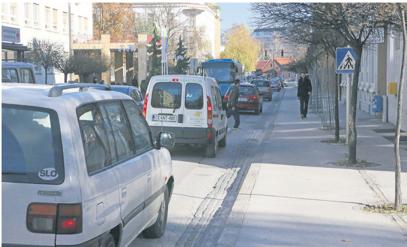
V Celju skupaj z industrijo največ delcev PM10 povzroča promet.

Ukrepi na področju učinkovite rabe energije in spodbujanja obnovljivih virov energije so usmerjeni predvsem v zmanjševanje emisij zaradi ogrevanja stavb. V Celju temeljijo na širitvi območij daljinskega ogrevanja in širitvi plinovodnega omrežja, v primernih naseljih, kjer te možnosti ni, pa bi k boljšemu zraku veliko pripomogli mikrosistemi daljinskega ogrevanja na lesno biomaso. Pri oskrbi z zemeljskim plinom ne smemo prezreti nujne zamenjave zastarelih kurilnih naprav, saj nove omogočajo večji izkoristek energenta. Slednje in nove priključke na plinovodno omrežje so letos v Celju že spodbujali s posebnim razpisom, ko je občina