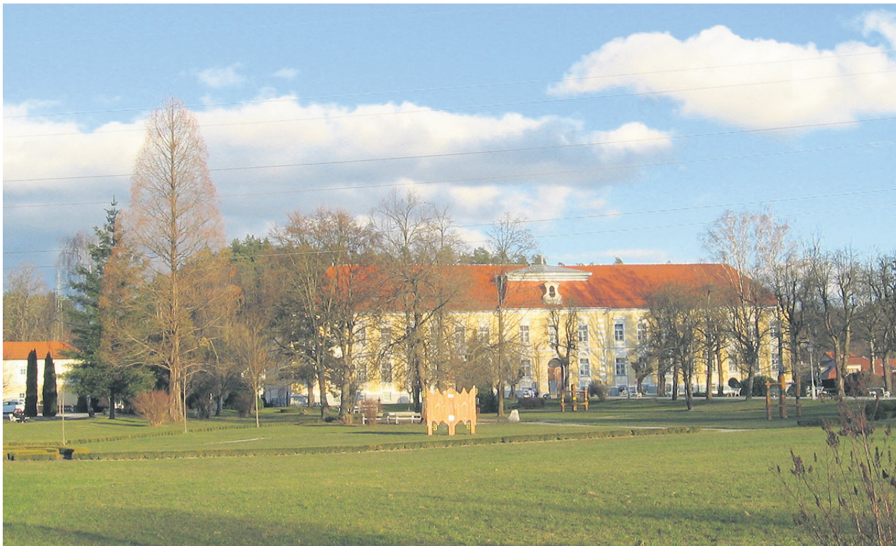
Dolgoletni spor med občino in državo je končan. Višje sodišče je zemljišča okoli vojniške bolnišnice prisodilo državi.