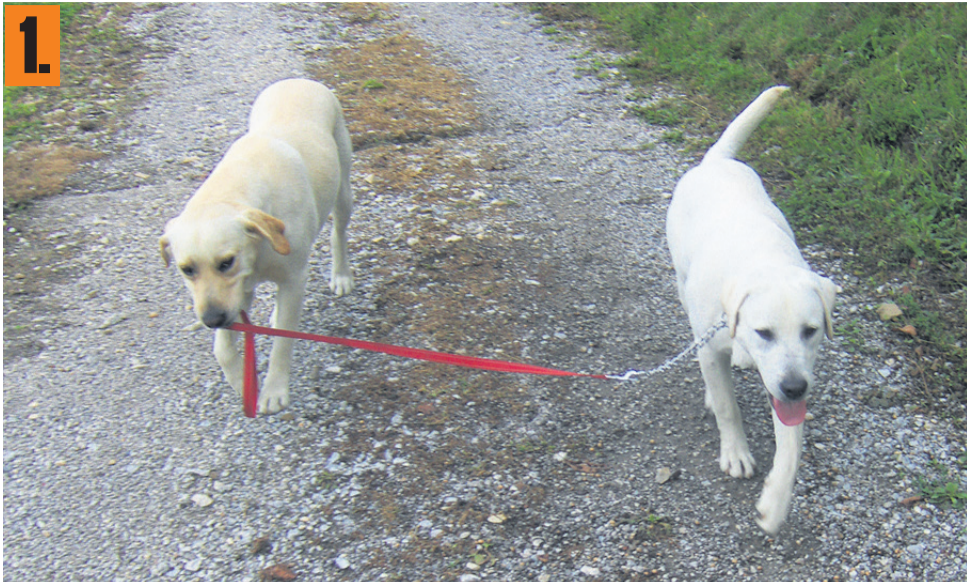
Beni pelje na sprehod Aika.