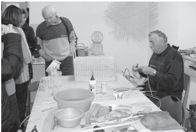
Razgovor z rokodelcem v delavnici Rokodelskega centra v Ribnici. Ribnica, 14. 1. 2012