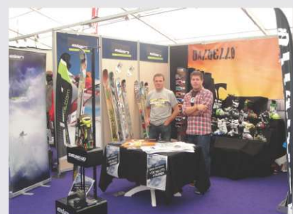
Elanov razstavnih prostor

Konec septembra se je v prečudovitem mestecu Annecy odvijal filmski festival, na katerem so glavno vlogo imeli najboljši freeski riderji iz vsega sveta. Predstavile so se največje filmske produkcije, ki so navdušile s svojimi izvirnimi kadri ter akcijo. Ob samem festivalu se je odvijal freeski expo, na katerem je bil prisoten tudi Elan/Dalbello s svojim razstavnim prostorom. Obisk je bil zelo velik, saj so Team riderji podpisovali svoje reklamne plakate, s tem pa privabili veliko število mladih navdušencev, ne le iz Francije temveč iz celotne Evrope!