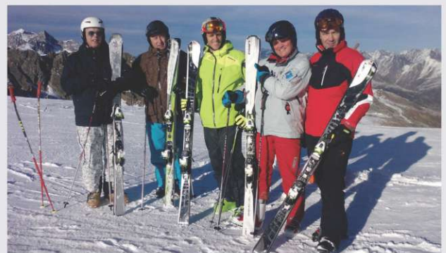
Amphibio smuči navdušile vse

Testiranja na snegu in dobra priprava smuči bodo ključnega pomena za prepričanje trgovcev in potrošnikov o dobri funkcionalnosti smuči Amphibio. Do decembra je smuči testiralo že več kot 250 ljudi in komentarji so dobesedno navdušujoči. Eno takih testiranj je bilo tudi na avstrijskem ledeniku Soelden, kjer smo spravili na smuči ključne nabavnike skupine Sport 2000 iz Norveške, Avstrije, Švice in Nemčije. Dobili smo zagotovilo, da bodo tudi prodajno podprli projekt Amphibio.