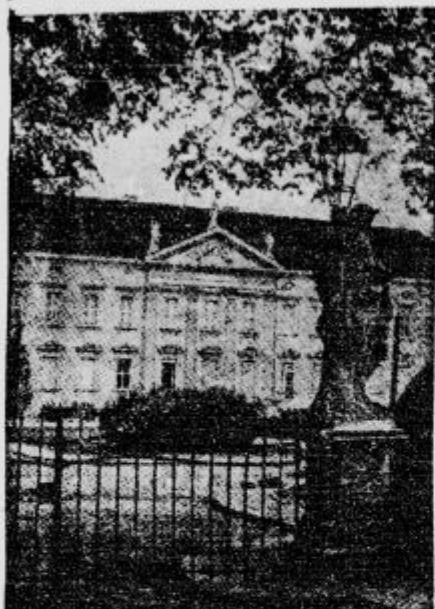
Palata »Bellevue« v Berlinu, kjer sta prebivala knez namestnik Pavle in kneginja Olga, ko sta bila na obisku v Berlinu