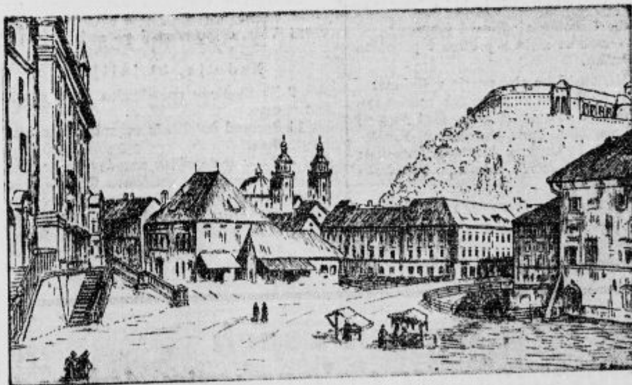
Šarjini trg v Ljubljani leta 1850