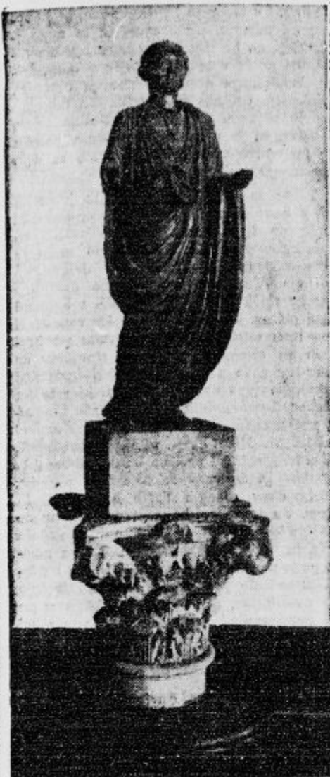
Bronasti kip Rimljana iz stare Emone, ki se sedaj nahaja v ljubljanskem muzeju