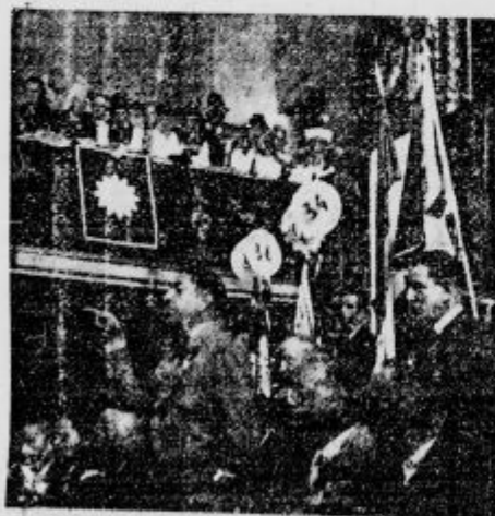
Predsednik vlade Dragiša Cvetković govori v Unionu.