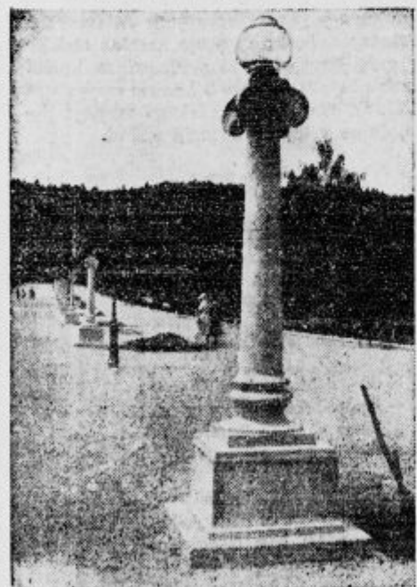
Sprehajališče v Tivoliju