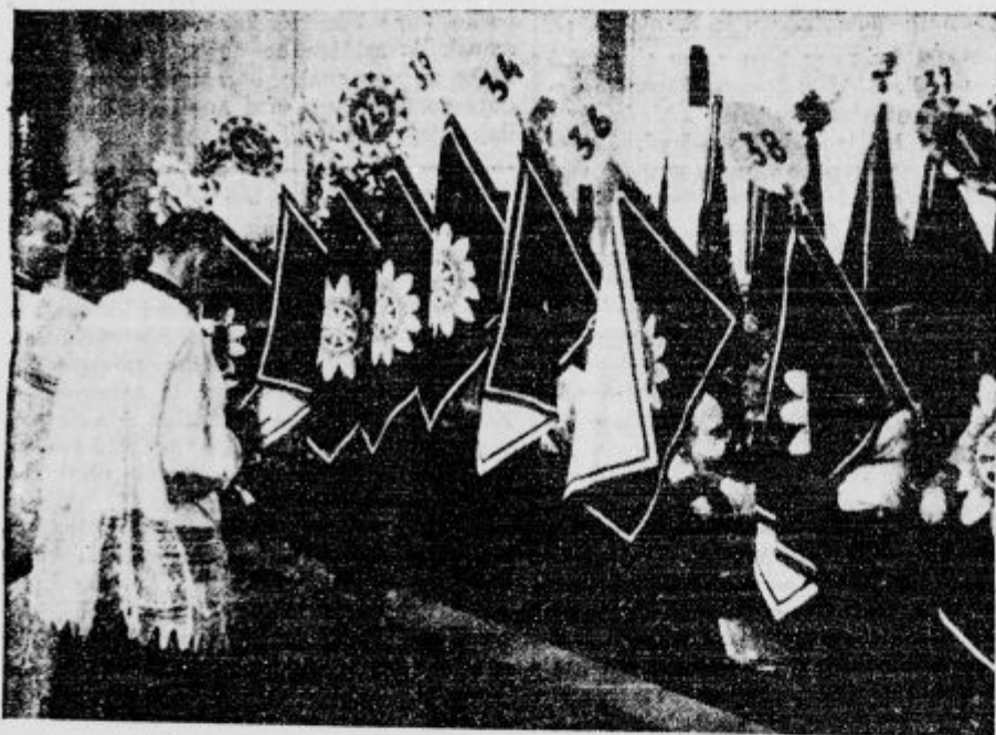
Z nedeljske delavske slavnosti v Ljubljani: Blagoslovitev zastav ZZZ.