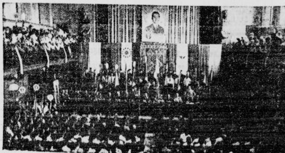
V dvorani »Union« med delavskim uobrovanjem ZZZ.