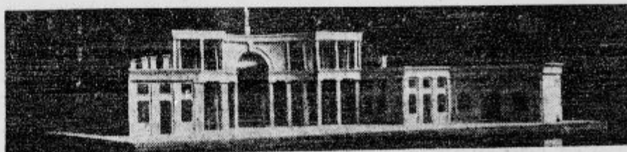
Zale pred pokopališčem Sv. Križa, kjer bodo počivali umrli Ljubljanci, dokler ne nastopijo svoje sodnje pot na pokopališče