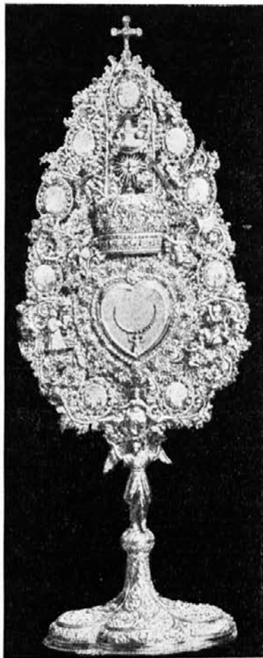
Dragocena umetniška monštranca iz Solothurna.

Sestrice ljubljene, pevajmo pesmice Hostiji sveti v pozdrav. Z belimi cvetkami, z zlatimi rožami venčajmo Kralja višav.