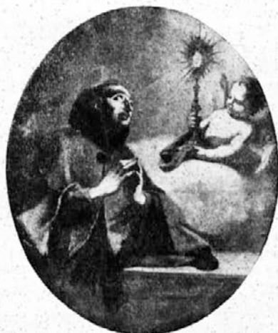
Sv. Pashal pred Najsvetejšim. (Slikal Val. Metzinger.)

Naj bi ljubili Jezusa mi, kakor, Pashal, si ljubil ga ti.