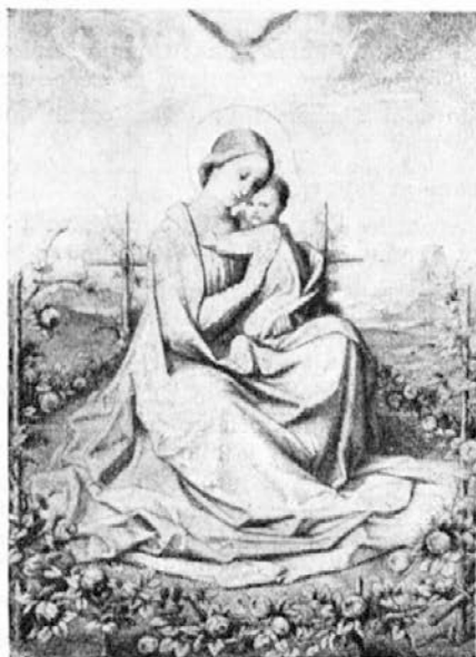
Nevesta Svetega Duha.