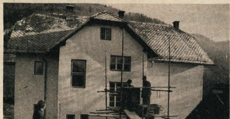
ŠE DIMNIK ZA CENTRALNO KURJAVO IN TUHINJSKA ŠOLA BO NARED