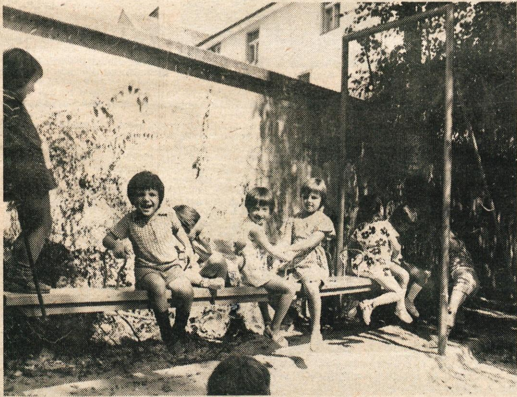
NAŠI OTROCI ZAHTEVAJO OD NAS NOVE VRTCE: V NAŠI OBČINI JE DANES DELEŽEN ORGANIZIRANEGA VARSTVA IN VZGOJE KOMAJ VSAK 16. OTROK. Z URESNIČITVIJO PROGRAMA, ZA KATEREGA BOMO GLASovali 20. DECEMBRA, BOMO LAHKO ZAJELI V VARSTVO NAJMANJ VSAKEGA PETEGA OTROKA, TUDI NA PODEŽELJU

V četrtek, 20. decembra letos, bomo vsak na svojem delovnem mestu glasovali za zbiranje sredstev za gradnjo šol in otroških vrtcev v prihodnjih petih letih. Naši najmlajši pričakujejo od nas, da jim svojega glasu za njihovo boljše vzgojo in izobrazbo ne bomo odrekli!