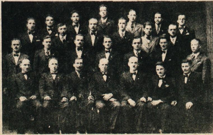
PEVSKI ZBOR SOLIDARNOSTI OB 20-LETNICI

Delavsko pevsko društvo Solidarnost je pri gojitvi lepe slovenske pesmi zavzemalo odlično mesto med našimi pevskimi zbori in je vsa leta s koncerti in nastopi ob raznih prireditvah dokazalo svojo požrtvovalno vneto in stremiljenje za napredkom. Obenem z zborom praznuje 20 letni jubilej dela