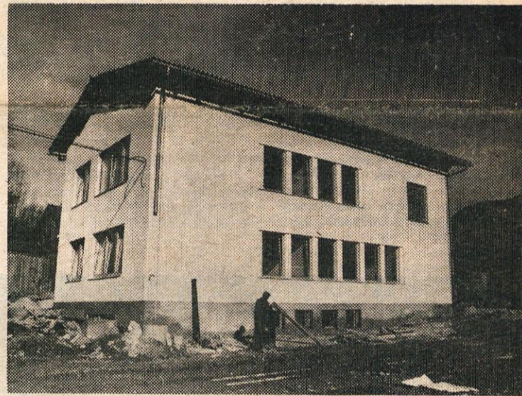
NOVA ŠOLA V ŠMARTNEM

Ob dnevu republike čestitajo vsem občanom in delovnim ljudem kamniške občine občinska skupščina in vodstva družbeno- političnih organizacij