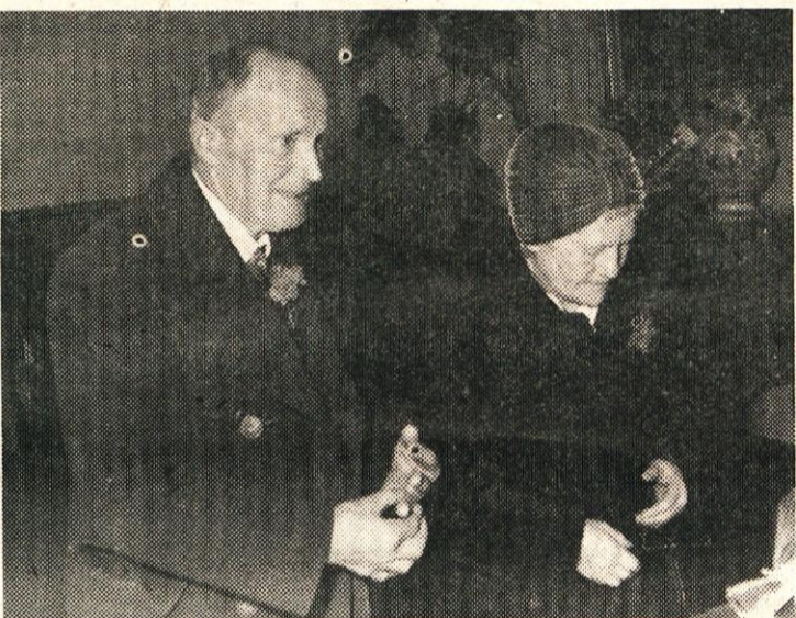
ZLATOPOROČENCA ERJAVŠKOVA STA PO PETDESETIH LETIH ZNOVA POTRDLILA SVOJO ZVEZO

„Več let sem bil z ženo oskrbnik kočice na Kokrškem sedlu. Leta 1937 sem odprl v Stahovici št. 7 krčmo, ki sem jo vodil do leta 1963. Po vojni so bile na Veliki planini razrušene in požgane vse pastirske kočice,“