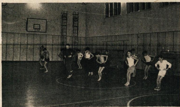
TELOVADNIC JE PREMALO. V PRIHODNIH LETIH BOMO ZGRADILI DVE NOVI TELOVADNICI; PRI SREDNJEŠOLSLEM CENTRU V KAMNIKU IN NA DUPLICI

Spomladi 1973 smo se na skupnem sestanku s predstavniki delovnih organizacij (direktorji, predsedniki sindikalnih organizacij) ter na občinski konferenci SZDL dogovorili, da za zbiranje sredstev v prihodnjem obdobju v delovnih organizacijah pripravimo referendum, na katerem se bodo delovni ljudje na podlagi programa neposredno odločali za združevanje sredstev.