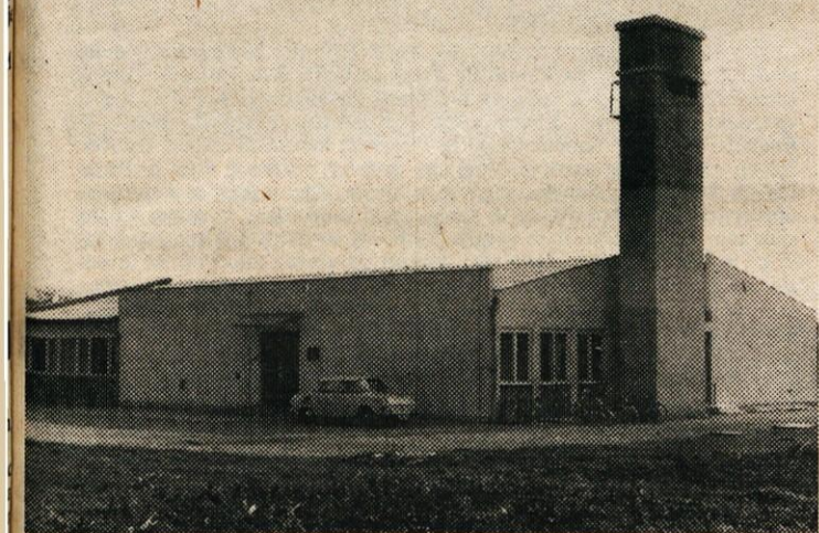
Z DOGRADITVIJO NOVIH PROSTOROV BO NAMESTO SEDANJE ŠTIRIRAZREDNE ŠOLE DUPLICA DOBILA POPOLNO OSEMLETNO ŠOLO

Program investicij za šolske objekte v času od 1968-71 zaključujemo šele v letošnjem letu z adaptacijo šole v Tuhinju in Šmartnem. Iz