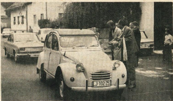
Z AVTOMOBILSKEGA RALLYJA V KAMNIKU