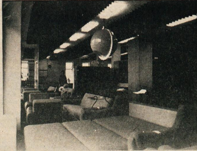
SALON POHIŠTVA V KAMNIKU: PRED DNEVI JE KAMNIŠKO TRGOVSKO PODJETJE KOČNA ODPRLA NOVO TRGOVINO S POHIŠTOM NA KRANJSKI CESTI. LOKAL MERI PREK 300 KVADRATNIH METROV, KAR OMOGOČA, DA SI KUPEC LAHKO OGLEDA ŠTEVILNE POSTAVLJENE GARNITURE SODOBNIH KUHINJ, SPALNIC, DNEVNIH SOB IN OSTALEGA POHIŠTVA

Trgovsko podjetje na veliko in malo čestita vsem občanom in delovnim kolektivom ob prazniku dneva republike – 29. novembru!