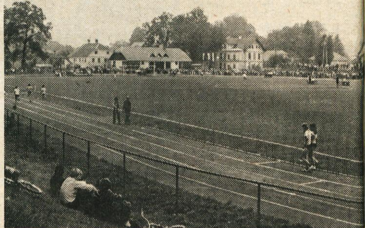
TELESNOKULTURNA SKUPNOST BO GOSPODARILA TUDI S ŠPORTNIMI OBJEKTI IN SKRBE LA ZA GRADNJO NOVIH NAPRAV. NA SLUŽBI: NEDAVNO ODPRT ŠPORTNI STADION V MEKINJAH