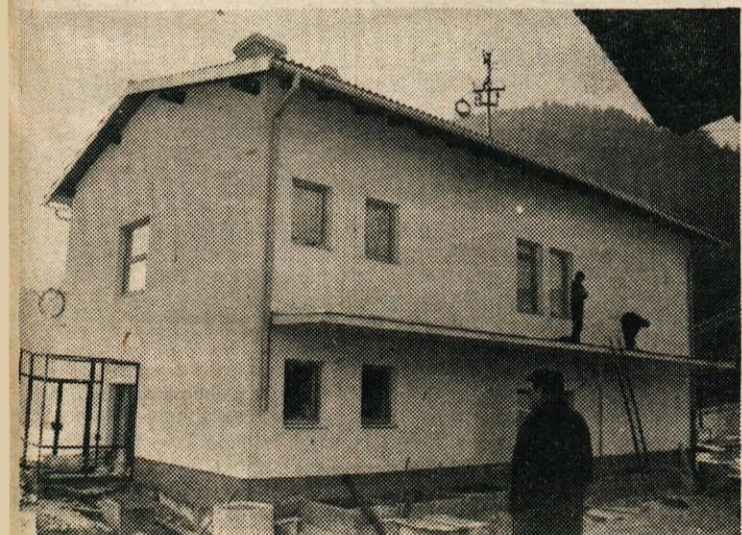
V DRUGEM POLLETJU SE BODO OTROCI IZ ŠMARTNA PRESELILI IZ RAZPADAJOČE 82 LET STARE ŠOLE V NOVO ŠOLSKO POSLOPIJE