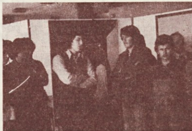
Razlaga je bila zanimiva, poslušalci pa pozorni