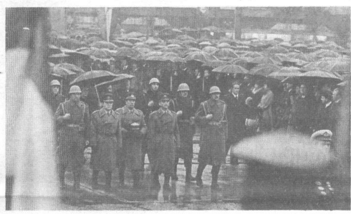
Nema, brezštevina množica, zadnje izkazane časti