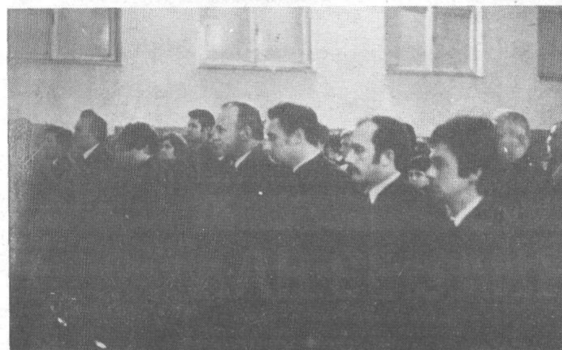
»Z molkom in tišino smo se poklonili junaku socialističnega dela«. Posnetek iz krajevne skupnosti Barje