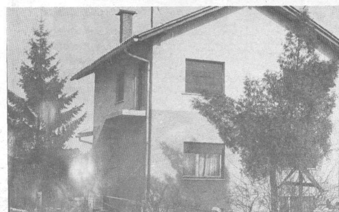
V tej (danes prenovljeni) hiši na Opekarski cesti v Trnovem se je pred 69 leti rodil Edvard Kardelj in na okolico ga je vezalo mnogo mladostnih spominov

Z zasrtnimi besedami na ustih, s solzami iskrenosti v očeh se v tem turobnem februarjem jutru soočamo z minljivostjo življenja ideologa naše polpretekle in kristjane revolucionarnosti, z neusmiljenim dejstvom smrti našega dragega tovariša Edvarda Kardelja — Krištoja.