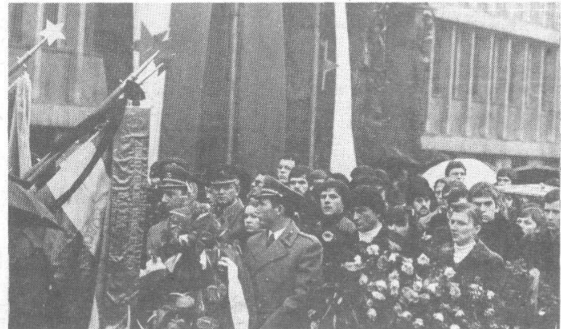
Cvetovi iskrenosti, veličastnost zastav v zadnji poklon

Skupščina in družbenopolitične organizacije občine Ljubljana-Vič-Rudnik pa so izraze globokega sožalja posredovale soprogini in hčerki Edvarda Kardelja, kot tudi predsedstvu SFRJ in predsedstvu SRS ter predsedstvu CK ZKJ in CK ZKS.