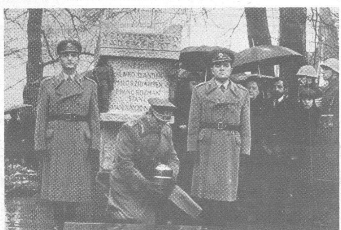
V grobnico narodnih herojev so položili žaro s posmrtnimi ostanki člana predsedstva SFRJ in člana predsedstva CK ZKJ tovariša Edvarda Kardelja