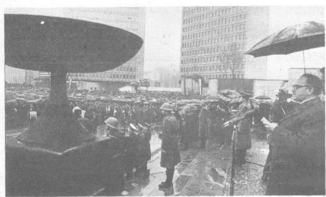
Misli bodo živele, njegovo delo nas bo spremljalo!