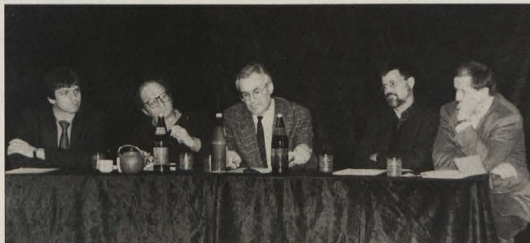
Podijska diskusija o obletnici 10. oktobra je bila ena izmed programskih točk, ki je izzvala živahno diskusijo