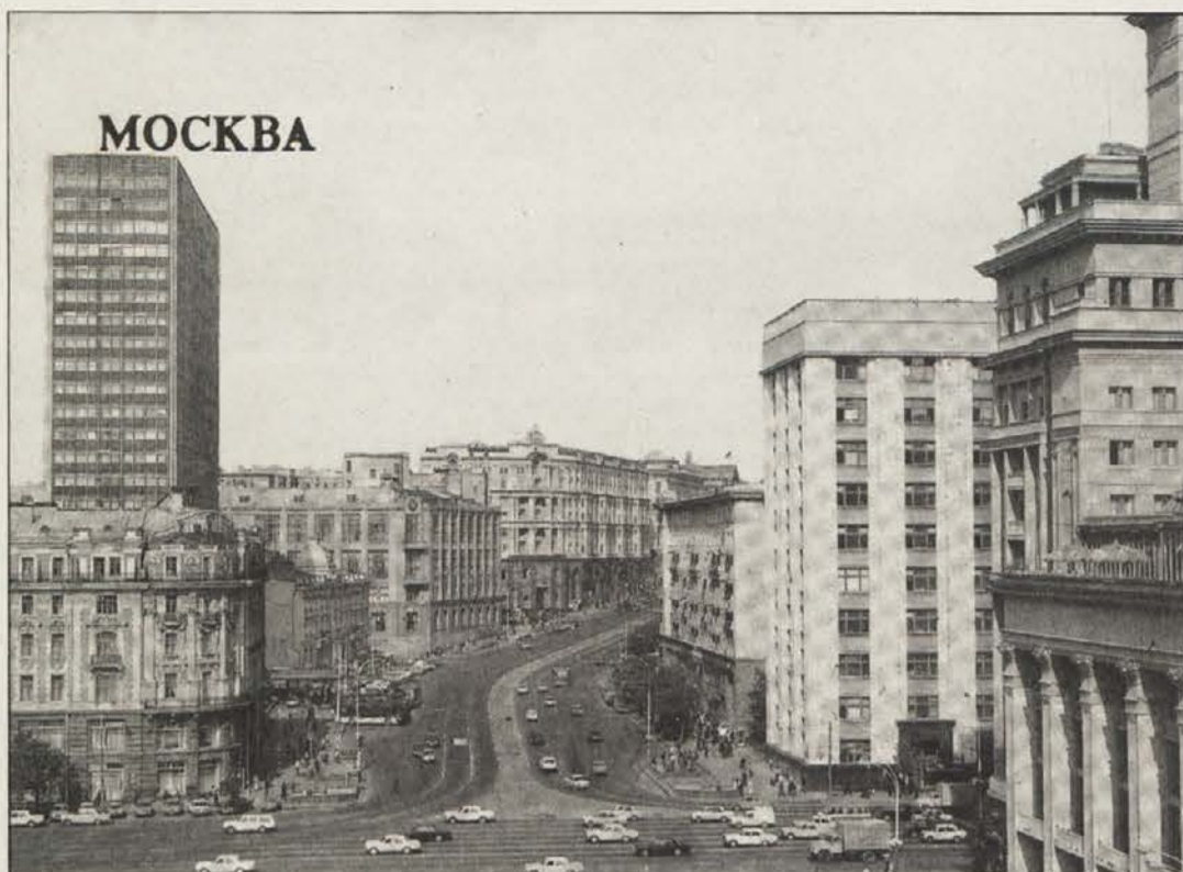
Znamenita Gorkijeva cesta – glavna cesta Moskve, skoraj preširoka za dejanske potrebe.

Potovanje v Sovjetsko zvezo je še vedno povezano z vizumi, gibanje po državi pa je omejeno. Za raziskovanje notranjosti so potrebna posebna dovoljenja, obisk marsikaterih predelov pa je tujcem še vedno prepovedan. Cilj našega potovanja je bila Moskva. Z dunajskega letališča nas je pospremila prekrasno, že skoraj pomladansko vreme, na moskovskem pa nas je pozdravila zima. Ne sicer tista prava z debelo snežno odejo in temperaturami okrog -20 stopinj, zato pa z redkimi snežinkami in nizko oblačnostjo. Formalnosti smo opravili hitro, zataknilo se je le pri prtljagi, ki je prišla „iz Pariza“ in ne – kot smo pričakovali – z Dunaja.