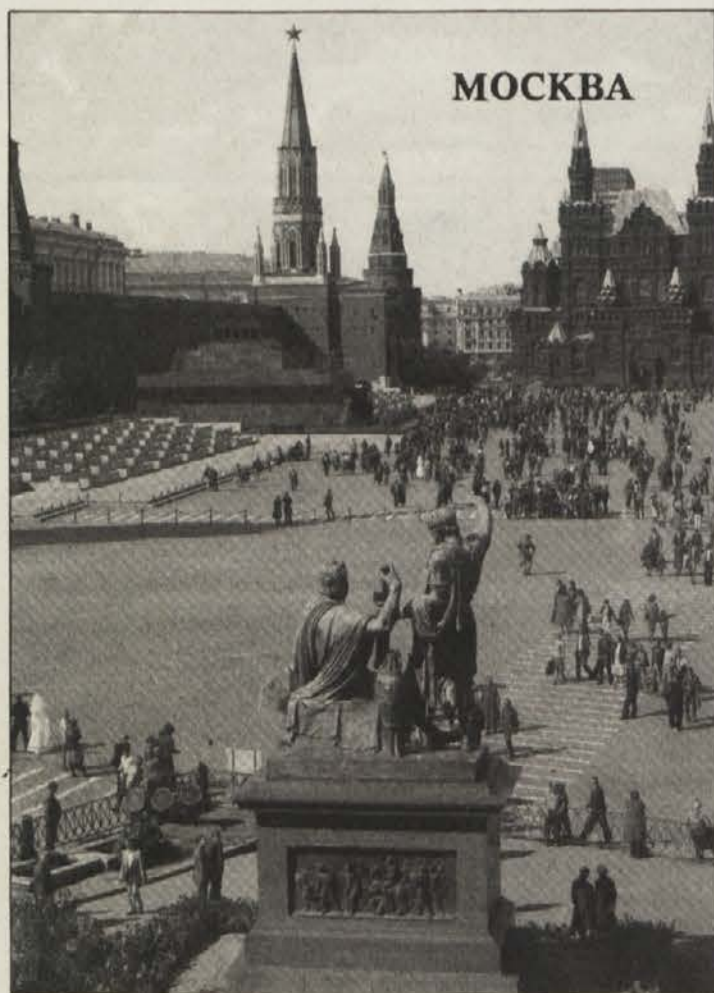
Rdeči trg z Leninovim mavzolejem – atrakcija prve vrste.