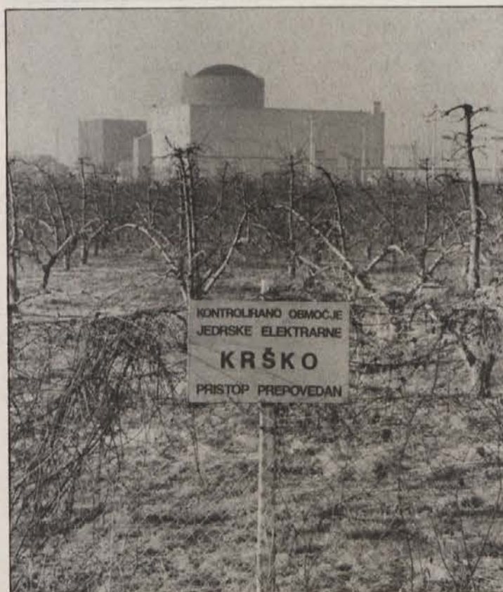
Bo JE v Krškem obratovala le še do konca leta 1995?