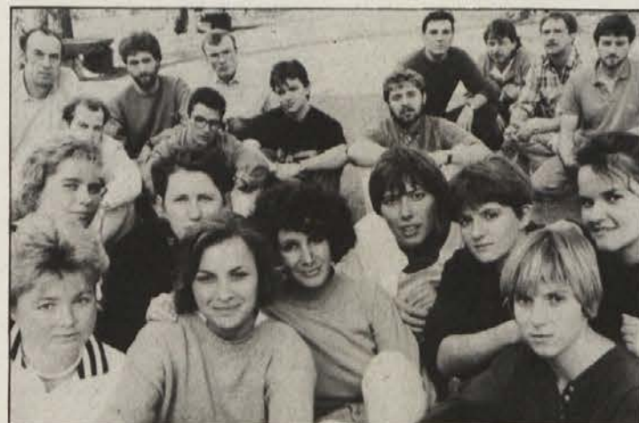
Pevci zbora vrhunske kvalitete Vocal Forum