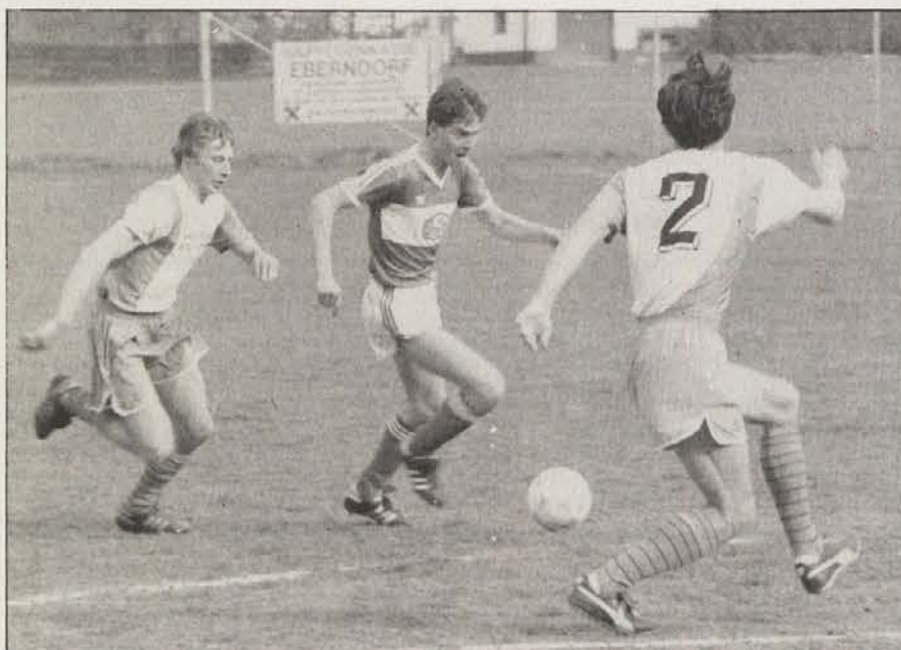
Napadi na tekmi med Globasnico in Selami so bili prava redkost.