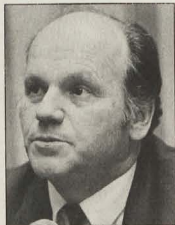
dr. Jože Pučnik