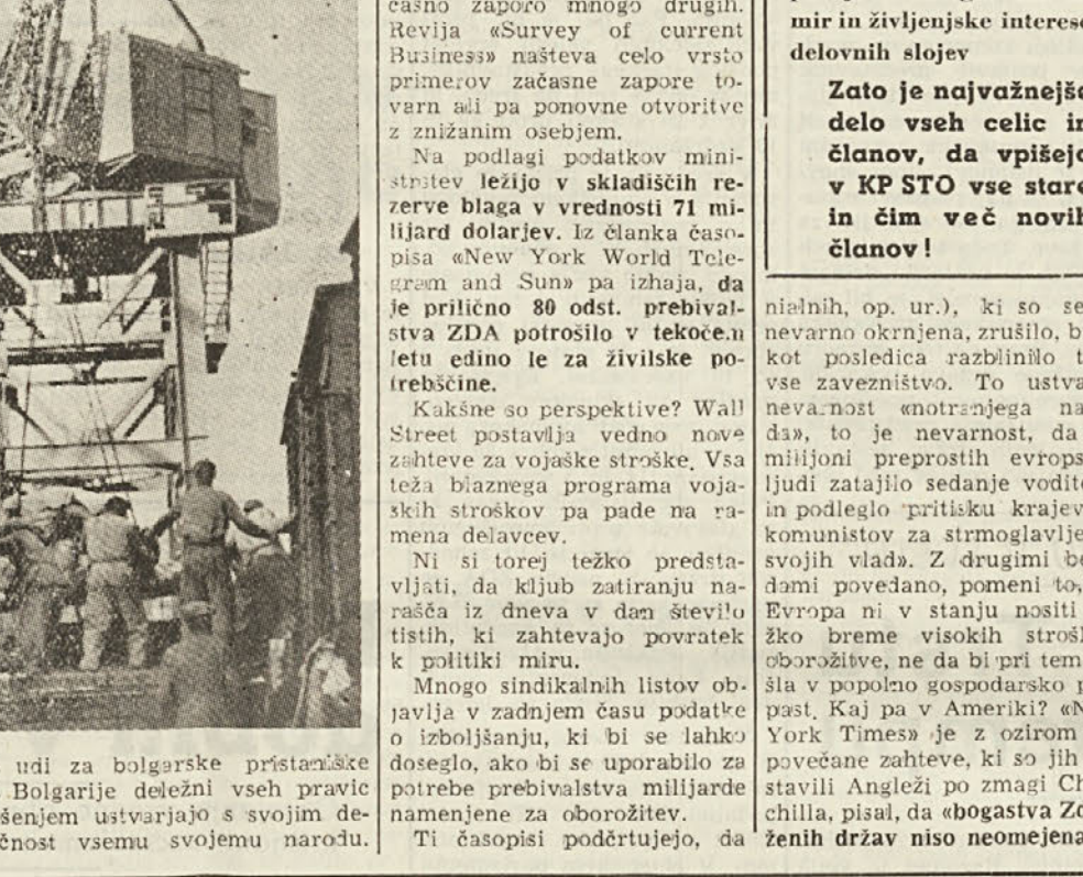
Prenehala je doba suženjstva tudi za bolgarske pristavčke delavce. Dnes so delavci LR Bolgarije deležni vseh pravic in svobodnih. Zato z navdušenjem ustvarjajo s svojim delom srečno, socialistično bodočnost vsemu svojemu narodu.