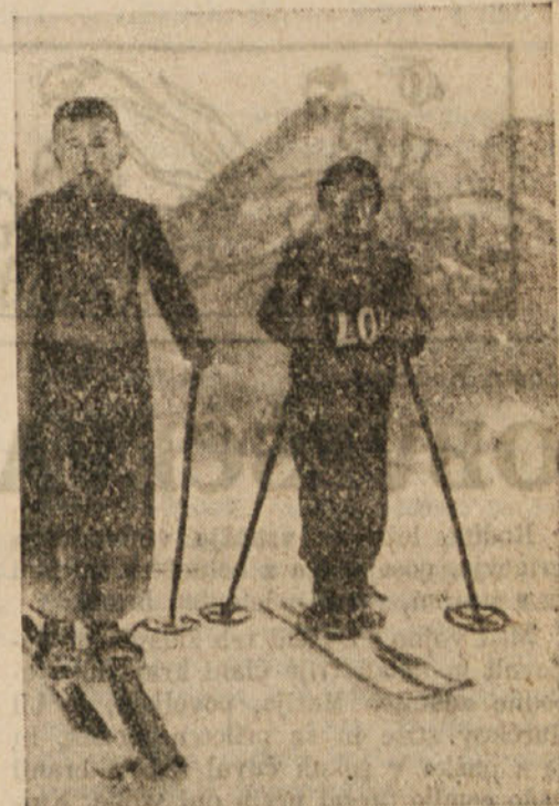
Pionirska smučarska tekmovalca

V predgovoru h knjigi je napisal, da zaradi tega, ker so Evropa, Azija in Afrika „točno raziskane in je Amerigo Vespucci odkril četrti del sveta, ne vidim ničesar kar bi oviralo da bi ga nazvali „Ameriga“, to je Amerigova dežela ali Amerika...“