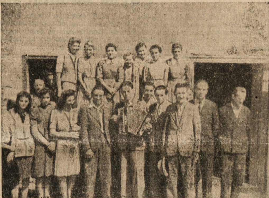
Pevci iz St. Ilja

Ena glavnih nalog je in bo skrb za naše najmlajše — pionirje. Njim moramo nuditi čim večjo pomoč. Pomagati jim moramo pri učenju maternega jezika, ki se ga v šoli ne morejo naučiti. Učimo in pripravljamo jih na kulturne prireditve, s katerimi bodo nastopili na pionirski dan. Skrbeti moramo tudi za postavitev okrajnih, občinskih in krajevnih pionirskih skupin, ki bodo našim malim nudile vse možnosti za čim boljše izobrazbo v narodnem jeziku in duhu. Na svojih sestankih morajo najti lepe in poučne slovenske knjige, imeti morajo možnost za izvajanje pionirske fizikulture in najti morajo razvedrila in zabave. Samo veseli in zdravi pionirji bodo postali odločni in zavdni sinovi svojega naroda, zato se moramo (Nadaljevanje na 2. strani pod črto.)