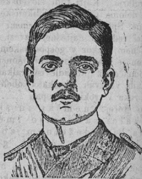
König Manuel II. von Portugal

Revolucija na Portugalskem je torej zmagala, kralj je za večne čase odstavljen in prebivalstvo je ob velikanskem navdušenju proglasilo republiko ali ljudovlado. Odločilo je v tem boju