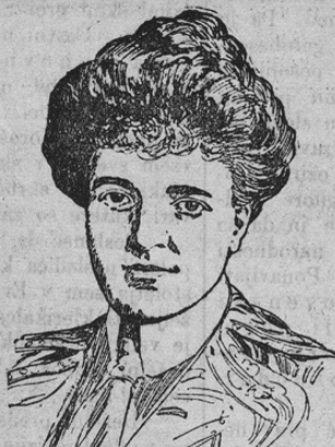
Königin-Witwe Amalije v. Portugal