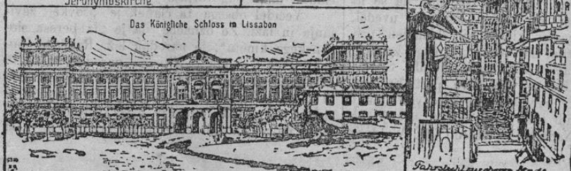
Das Königliche Schloss in Lissabon