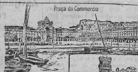
Praça do Commercio