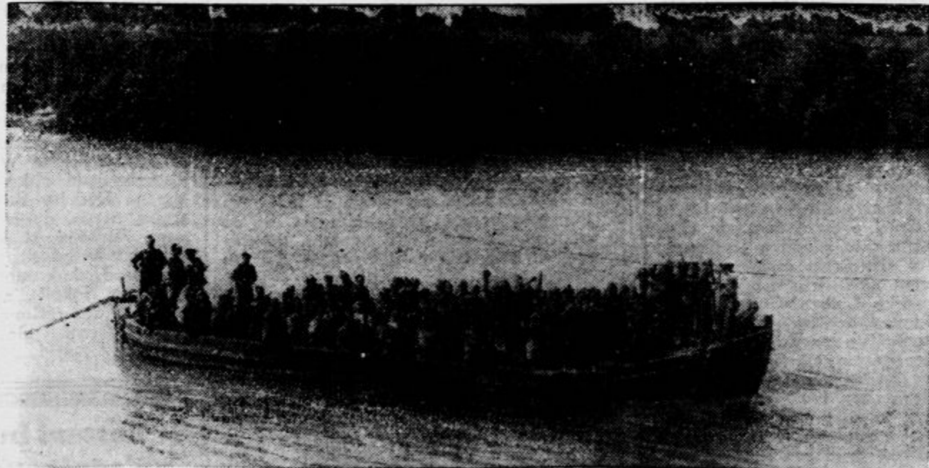
Cete španskega uporniškega generala Queipa de Liana ob prehodu čez Guadalquivir, odhoder so se napotile naprej proti Cantillan