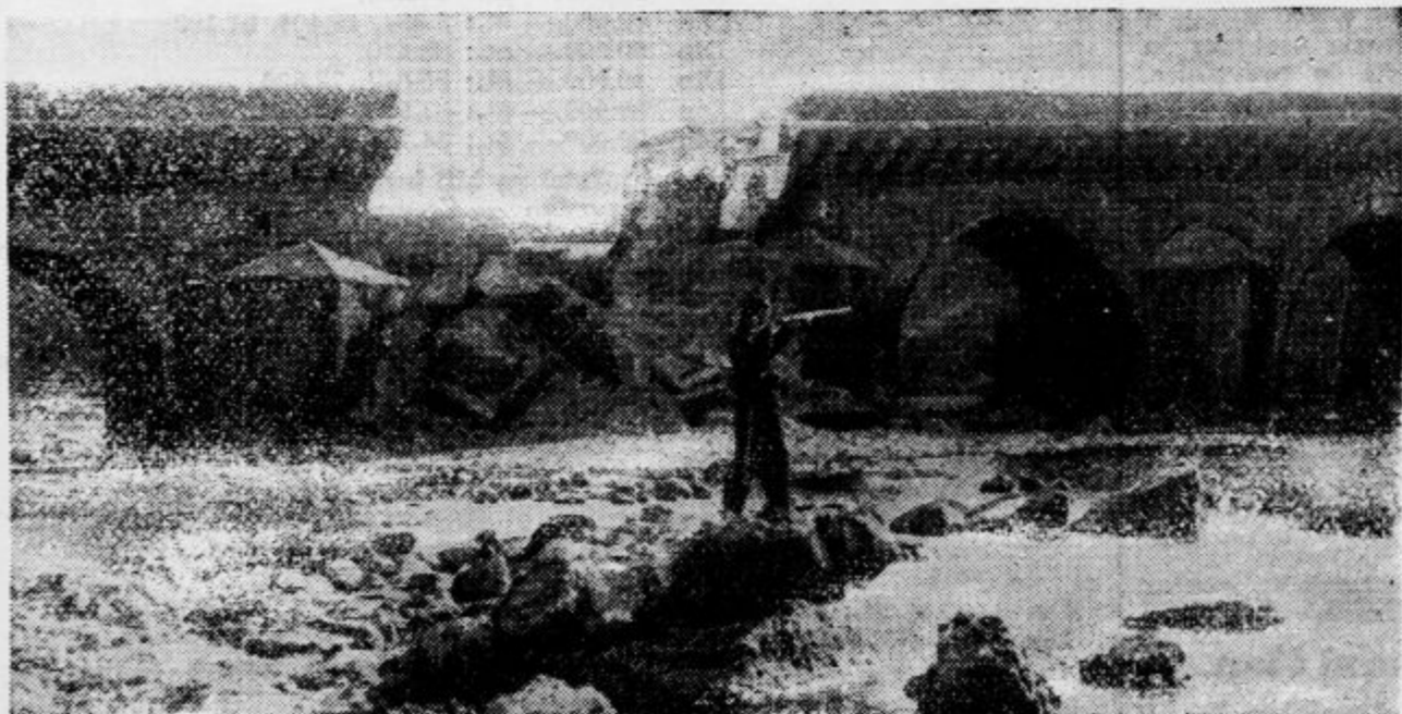
Straža iz vojske generala Queipa de Liana čuva most Niebla Huelva čez reko Tinto. Most so porušile čete španske vlade, da bi zadržale pohod uporniške vojske