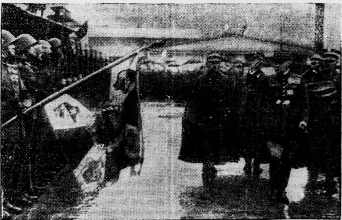
Šef francoskega gen. štaba Maurice Gamelin ob prihodu v Varšavo, kjer mu poljska vojska izkazuje častni pozdrav. V njegovem spremstvu inspektor poljske armade, general Rydz-Smigly