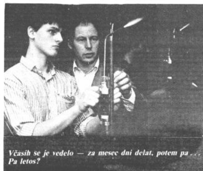
Včasih se je vedelo — za mesec dni delat, potem pa... Pa letos?