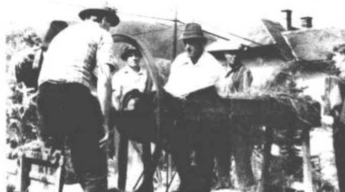
Mladi zadružniki in zadružnice so se res izkazali