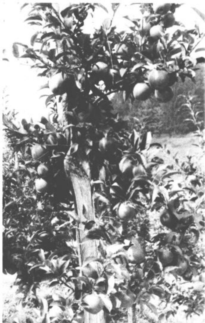
Lepa zdrava jabolka

Če bomo vse to postorili, se lahko mirno odpravimo na dopust, saj bo sadno drevje vsaj nekaj časa počivalo. Z drugimi besedami: jablane in hruške so se umirile v rasti in sedaj pospešeno dobavljajo hrano v plodove. Ko se vrnejo iz dopusta, pa bomo opravili letno ali zeleno rez, o tem pa več kdaj drugič.