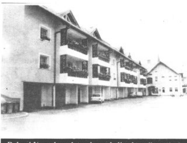
Delavci Vegrada se lotevajo vse bolj zahtevnih gradenj.

Načrti in razvojna hotenja Vegrada so torej jasna. Četudi preživljajo še vedno težke čase. Likvidnostne težave, s katerimi se otepa celotno slovensko in jugoslovansko gospodarstvo jih niso obšle. A spretno jih premagujejo, to pa zato, ker povečujejo delež proizvodnje na tujem, kjer delajo za solidne investitorje, ki opravljeno delo tudi redno plačujejo. Mira Zakošek