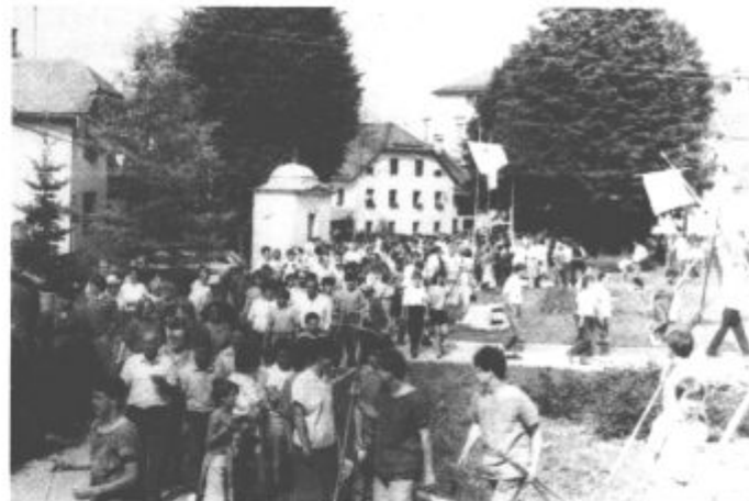
Takšne prireditve in takšne množice v Gornjem Gradu še zlepa ni bilo