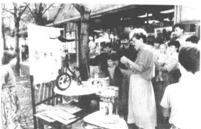
Prvo žrebanje je mimo, drugo bo 14. septembra.