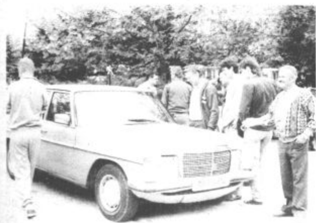
Ponudba na sejmu je eno, želje in možnosti pa drugo