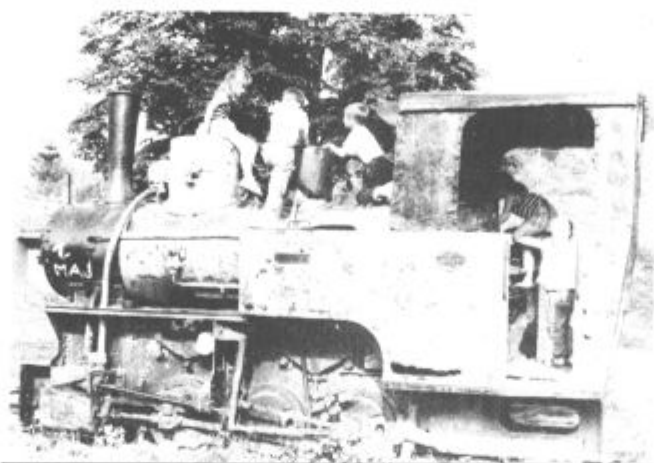
Otroci so veliki raziskovalci — prisluntni je treba njihovim interesom

Precej težav imajo z načrtovanjem dela saj je precej velenjskih kolektivov prešlo na evropski delovni čas. Zaenkrat je bilo otrok, ki so potrebovali podaljšano varstvo za 12 oddelkov in 4 varstva na domu, jeseni pa jih bo verjetno še nekoliko več. Spoznali so, da starši niso zainteresirani, da bi vrtce razdelili tako, da bi nekateri delali po starem, drugi po evropskem delovnem času (interese za varstvo bi verjetno precej upadel, saj želijo imeti starši otroke v vrtcu čim bližje domu), zato bodo prisiljeni še naprej delati kombinirano. To pa seveda pomeni nekaj dodatnega dela, dodatnih ur vzgojiteljic. Doslej so to razreševali delno s prerazporeditvijo delovnega časa, delno z nadurnim delom. Vendar pa bo treba pritegniti k sodelovanju še kakšno novo vzgojiteljico. S pridobitvijo kadra pa so težave. Letos zadnjič, so lahko zaključile vzgojiteljice izobraževanje na srednji stopnji (v bodoče bo obvezno višješolsko izobraževanje) in se jih večina že sedaj odloča za nadaljnji študij.