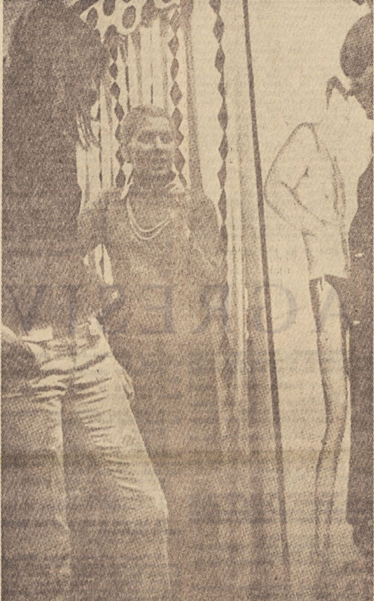
»Raziskujemo praznino. Obožujemo ritual. Vsakdanjem opravkom je treba vrniti smisel plemenitosti...«