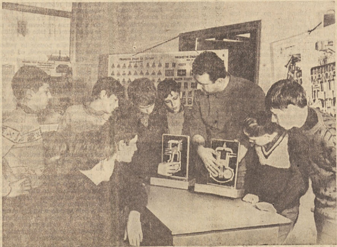
Na osnovni šoli v Kočevju uspešno deluje družina pionirjev prometnikov: z zanimanjem sledijo razlagi o prometnih predpisih, še bolj pa jih zanima delovanje bencinskega motorja, kot kaže naša slika

S katalogom želimo pomagati pri ugotavljanju slovenske normale na podlagi slovenskih poprečnih, sedanjih razmer in možnosti. Želimo pa tudi sodelovati pri odpravljanju nesorazmerij, ki se pojavljajo v posameznih dejavnostih, med dejavnostmi, poklici, območji itd. Prepričani smo namreč, da so razlike v družbenem in materialnem položaju delavcev (zlasti tudi razlike v osebnih dohodkih) lahko le posledica razlik v zahtevnosti in uspešnosti dela ter posledica stvarnih razlik v življenjskih razmerah (življenjski stroški, materialni položaj delavcev v gospodarstvu itd.), torej rezultat zavestnih odločitev, nikakor pa ne stihije. Zato katalog nikakor ne podpira uravnilovskih teženj, marveč težnje po redu in razumnih medsebojnih razmerjih!«