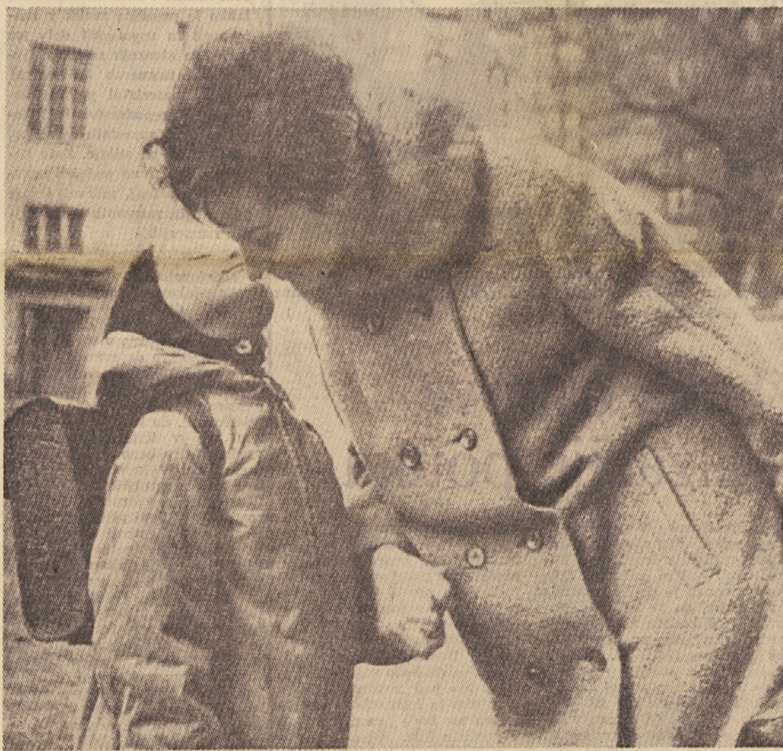
»Tako, in nasvidenje pa lepo priden bodi, popoldne se spet vidimo...«