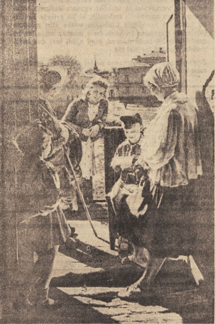
Aleksander Ivanovič Laktionov: »Pismo s fronte« — olje — 1947, Moskva, Tretjakovska galerija