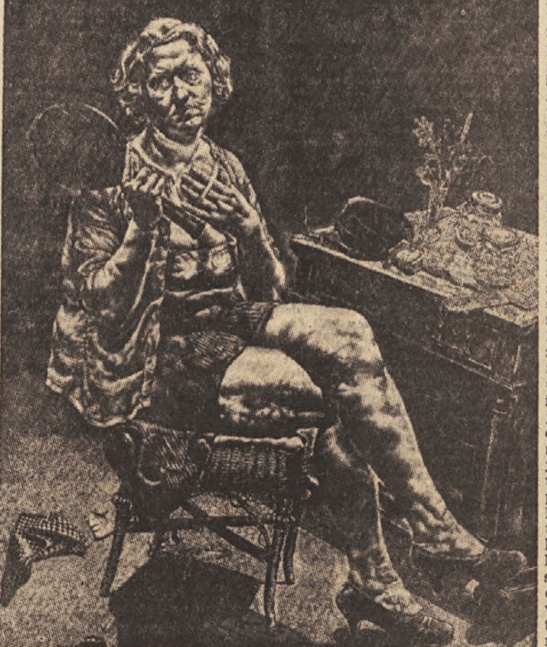
Ivan Albright: »V svetu, kamor je prišla duša z imenom Ida« — olje 1927—1930, Umetniški inštitut v Chicagu