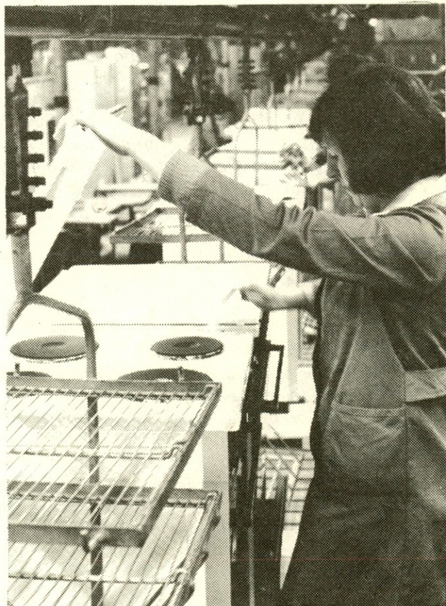
Delavci tozda kuhlalni aparati zaradi porušene strehe delajo na montažnem traku v tozdu štedilniki.

Najpomembnejše ugotovitve bodo služile tudi kot izhodišča za sestavo podrobnih načrtov, kako izboljšati poslovni uspeh, kako utrditi naša stabilizacijska prizadevanja in podobno. Zato naj bodo analize podrobne in hkrati tehtne. Ocene naj bodo jasne. Prav gotovo ni enotnega recepta, po katerih bodo vodje tozdv v posameznih delih analizirali svoj položaj.