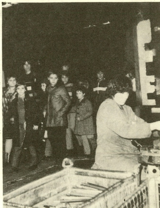
V 2. številki Informatorja bi morali ob prispevku „Novoletna srečanja“ objaviti fotografijo z obiska otrok umrlih delavcev Gorenja. Otroci so si z zanimanjem ogledali proizvodnjo v tozdih Štedilniki, Pralna tehnika, Hladilna tehnika in Kuhalni aparati.