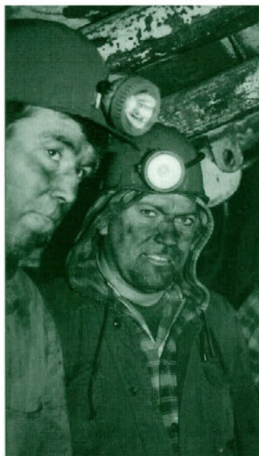
Srečno tudi v letu 1998!