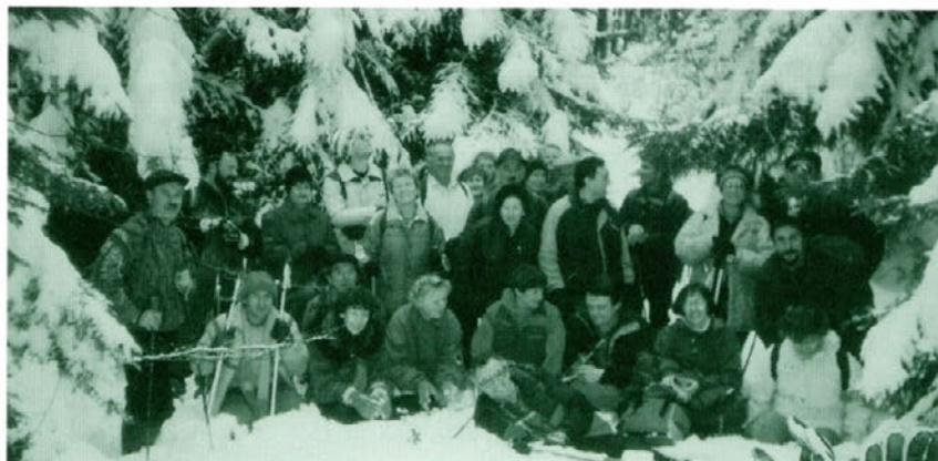
S Štefanovega pohoda pred leti