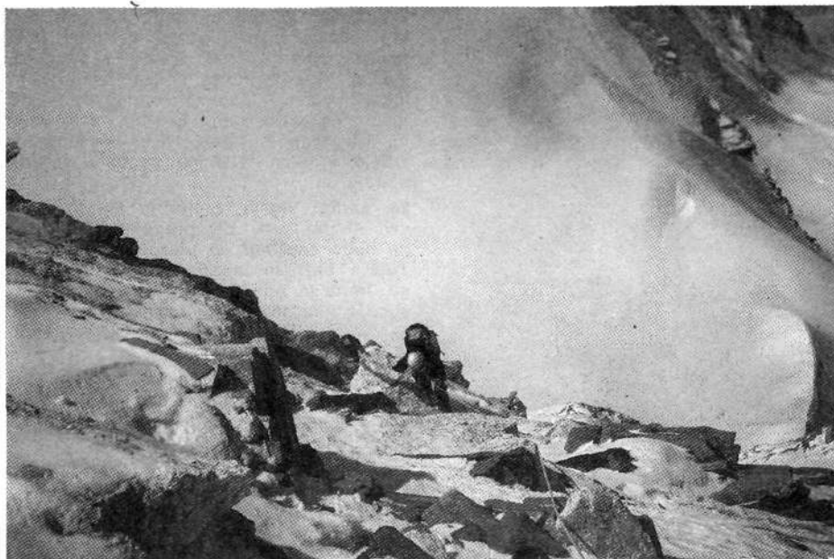
Plezanje na vrh Viking — spodaj je tabor 1 (5700 metrov) — v megli

11. aprila: Zjutraj dolgotrajno pogajanje z nosači. Zelo navijajo cene, vendar do zadnje vasi dobimo še kar ugodno ceno za te kraje, ki so močno zasedeni s trekingi. V Pokari opravimo še zadnje nakupe zelenjave in precej pozno zapustimo mesto. Imamo 64 tovorov. Prespimo v Nagdandi. Zvečer udari strela v sosednjo hišo.