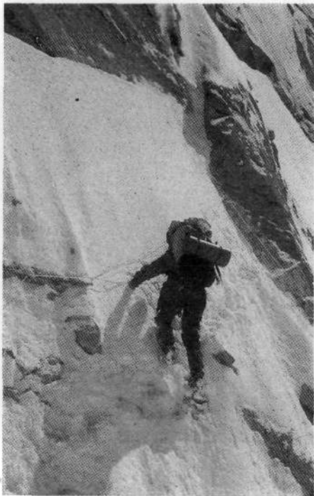
Prečnica pod Ptičjo glavo