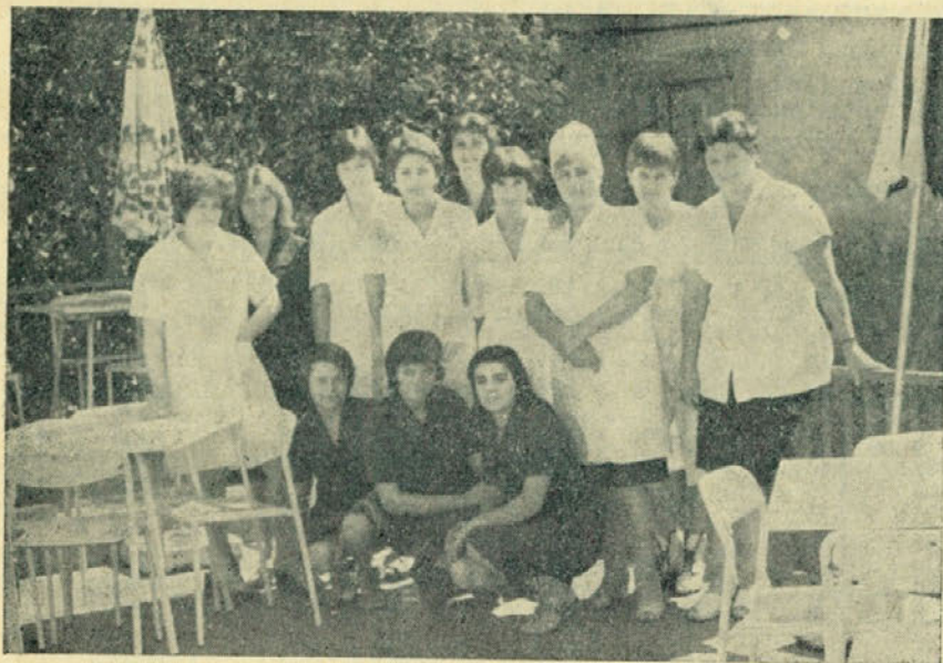
Požrtvovalna ženska delovna skupina v Počitniškem domu Biograd n/m v sezoni 1978