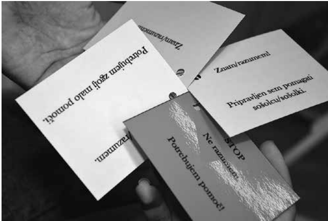
Slika 1: »Semafor« z dodano vijolično kartico, ki omogoča vrstniško sodelovanje

zgodbe »Dan o življenju družine Globalni državljani« 3 je tisti, ki je zaznal povezavo besedila s svojim primerom, poprijel za klobčič vrvice in ga ob naslednjem primeru podal naprej. Udeleženci so tako oblikovali mrežo, ki simbolizira povezanost sveta. Tisti, ki so izbrali primere, ki v zgodbi niso bili neposredno omenjeni, so ob podpori vprašanih in po potrebi tudi vrstniške pomoči določili povezavo z zgodbo (na primer poznavanje: »Kaj je fotografiji?«, »Opiši predmet pred seboj!«; razumevanje in analiza: »Kako je tvoj/a fotografija/predmet povezan/a z drugimi fotografijami/predmeti?«, »Kje opažaš podobnosti/razlike? Kaj je pri tem bistveno?«). Ob ugotovitvi povezave z ostalimi, ki so bili že omreženi, so tudi sami poprijeli za klobčič volne, in se povezali v skupno (globalno) mrežo.