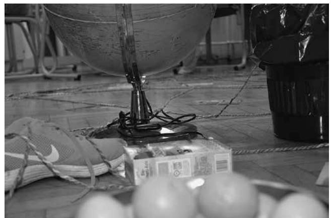
Slika 3: Razpad mreže

Sledila je sinteza dejavnosti in refleksija, ki je temeljila tako na kognitivnih (na primer »Kaj je temeljno sporočilo zgodbe?«) kot na emocionalnih vprašanih (»Kako ste se počutili, ko ste gradili mrežo?«, »Kako ste se počutili, ko ste videli, da mreža počasi razpada?«, »Kaj je v dejavnosti/zgodbi pomembnega zate, za druge?«).