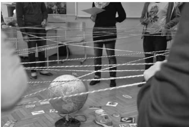
Slika 2: Mreženje, ki simbolizira povezanost sveta.

V naslednjem koraku so udeleženci s primerom iz svojega življenja še sami omrežili svet. Na tem mestu se je kot