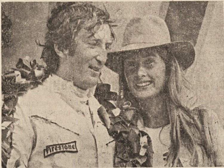
Četrta slika „veselga“ Jochena Rindta, ker je že četrtič zmagal v formuli I svetovnega prvenstva. Rindt ima zdaj po tej zmagi že 36 točk, pred Brabhamom (Avstralija) 25, in Stewartom (Vel. Britanija) 19 točk.

Drugi je bil Beltoise na vozilu Matra, tretji pa Brabham na vozilu Brabham ford. Po šestih dirkah vodi Rindt s 29 točkami