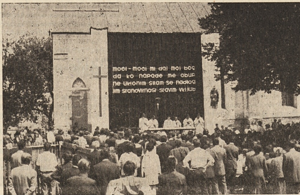
Nova maša č. g. Dersule v št. Petru pri št. Jakobu

V njegovi pogumni iniciativi in objektivnosti je bila moč njegovega vpliva, ko se je lotil vsakega vprašanja brez presledkov, in prav zaradi tega ga bomo ohranili tudi mi, koroški Slovenci — kot kritičnega tovariša — v trajnem spominu.