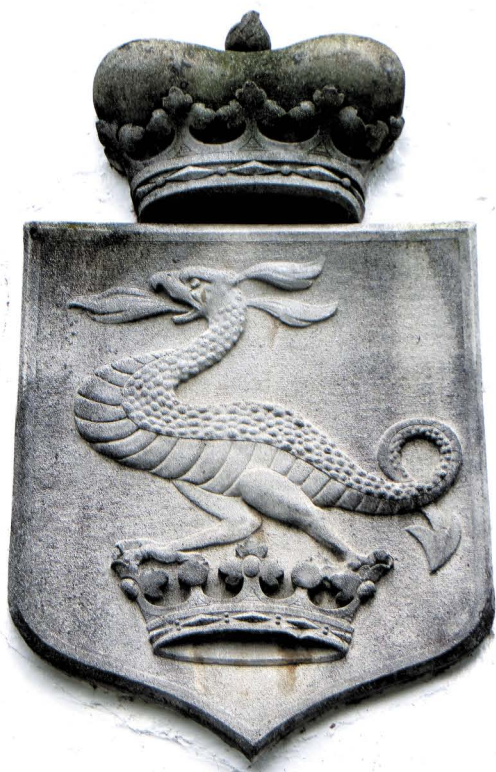
Slika 5: Grb rodbine grofov Wurmbrand-Stuppach iznad portala gradu Ormož.