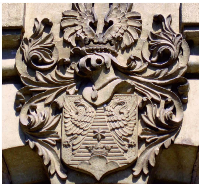
[Slika 4: Grb rodbine Pongratz-Lippit, kamniti relief nad portalom dvorca Maruševec v Zágorju. 10