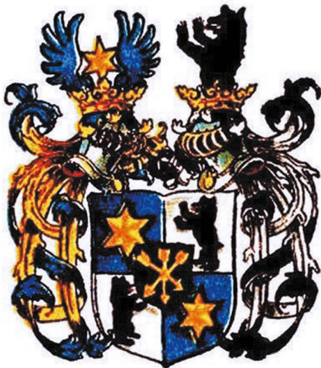
[Slika 3: Grb rodbine Zschock. 8

štiri polja, potem pa mu je dodano še srčno polje. Na poljih levo zgoraj in desno spodaj je prikazana šesterokraka zlata zvezda na temnomodri podlagi, na poljih. Desno zgoraj in levo spodaj pa je na beli podlagi upodobljen črn medved. Na srčnem polju so na črni podlagi prikazane tri prekrížane zlate puščice z ostmi obrnjenimi navzdol.