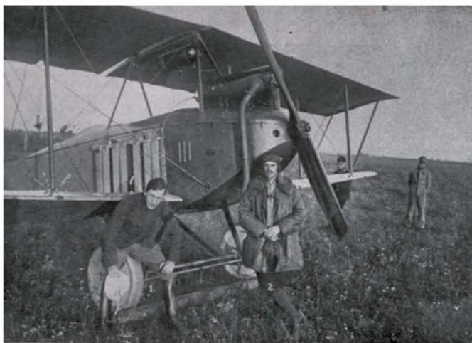
Rittmeister Guido Georgievits de Apadia (1) mit seinem Piloten Oblt. von Alexey (2).

Slika 9: Slika s spleta prikazuje na levi na kolesu dvokrilnega letala sedečega stotnika Guida Georgeviča de Apádia, desno od njega je nadporočnik pl. Alexey. Dvokrilno letalo je takrat služilo za opazovalne prelete nad bojišči. 15