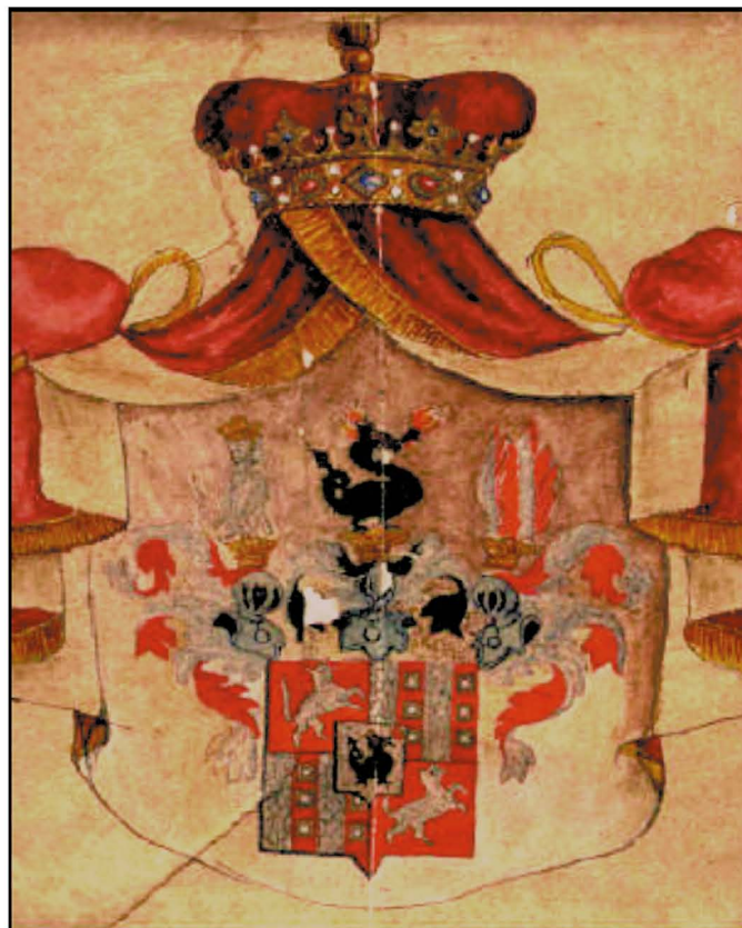
Slika 6: Grb rodbine grofov Wurmbrand-Stuppach. 12

Grbovni ščit je najprej razdeljen v štiri polja, v sredini pa ima še peto, srčno polje. Levo zgoraj in desno spodaj je na rdeči podlagi upodobljena žival iz družine mačk(?), desno zgoraj in levo spodaj sta geometrijska motiva, v centralnem polju pa črn zmaj, ki bruha ogenj. Zmaj se ponovi še v okrasju nad grbom, prikazan v kombinaciji z grofovskima kronama.