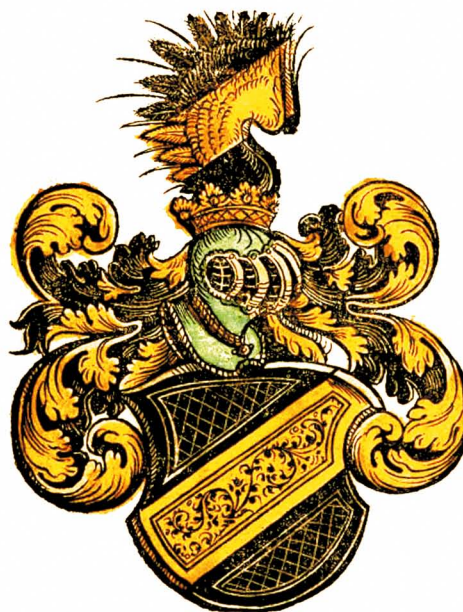
Die Gäller / r.

Baronica Elizabeta Pethe de Hetes je leta 1733 napisala oporoko, s katero je ormoško gospostvo zapustila sorodniku po materini strani grofu Gallerju, a je bila oporoka neveljavna, o čemer je pisal že Fran Kovačič. 5 Grb Gallerjev ima poševen črn trak preko zlatega grbovnega polja (sl. 2).