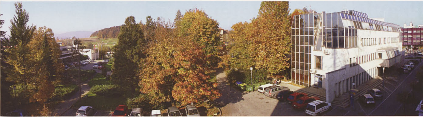
Romantičnega pogleda na staro komando JLA kmalu ne bo več ...