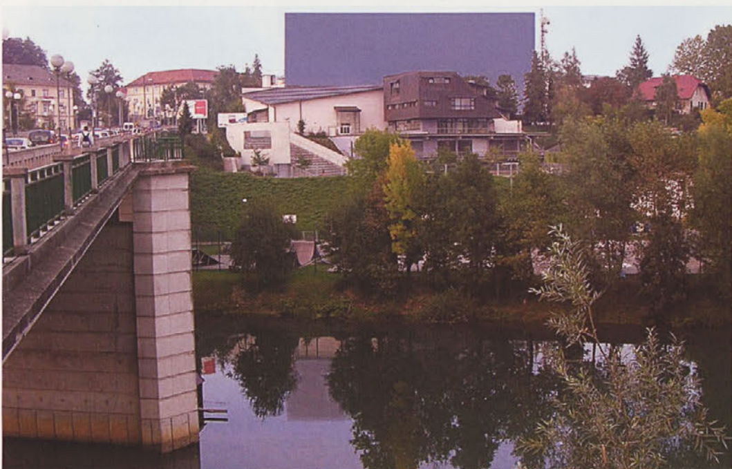
Tak pa bi bil pogled s Šmihelskega mostu.