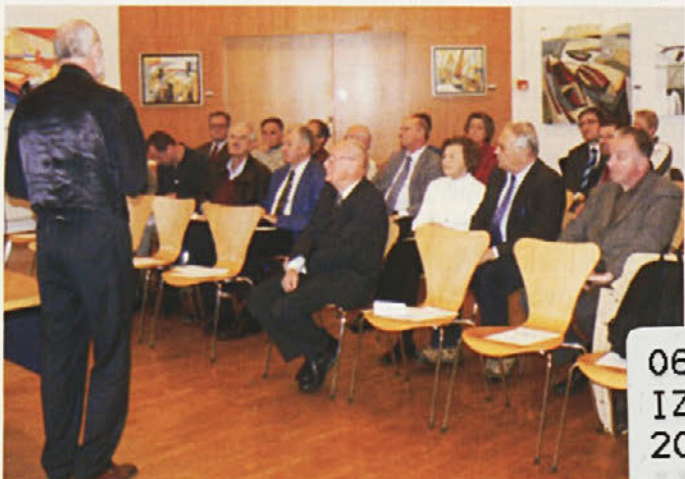
Poslušalci so vidno vznemirjeni spremljali grozljive napovedi.