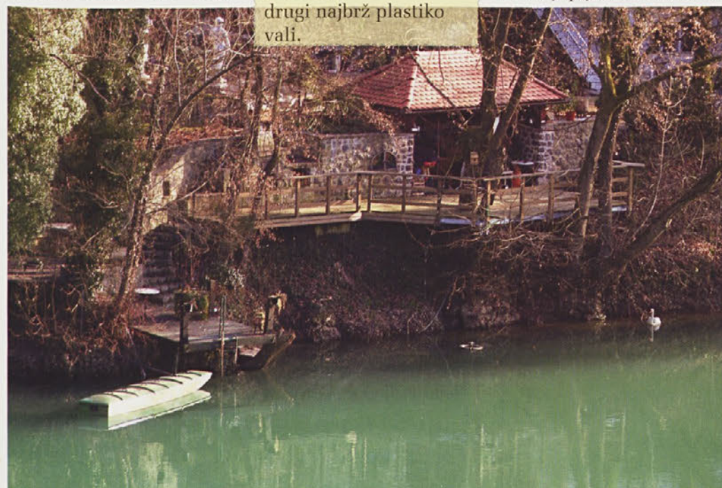
Brez besed ...

28. februar 2008 – OBČNI ZBOR ob 19.00 v Narodnem domu.