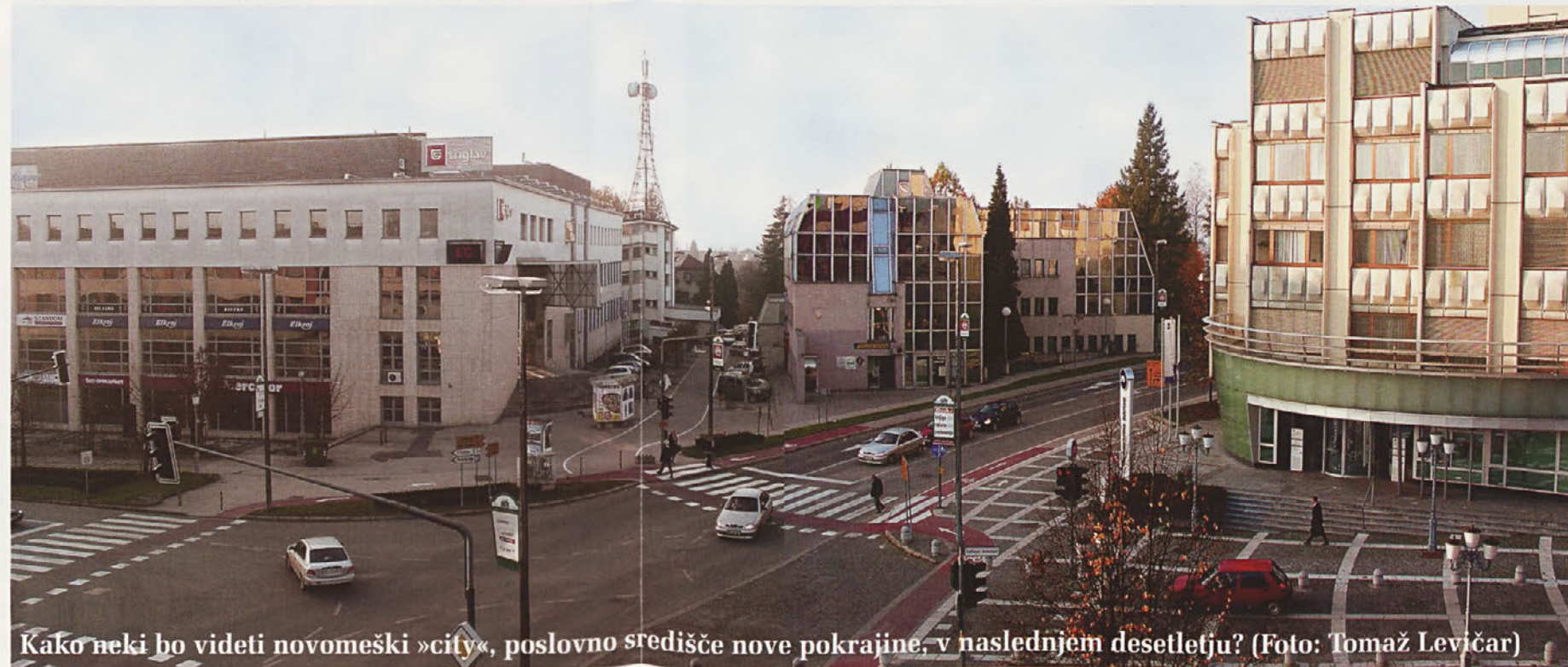
Kako neki bo videti novomeški »city«, poslovno središče nove pokrajine, v naslednjem desetletju?