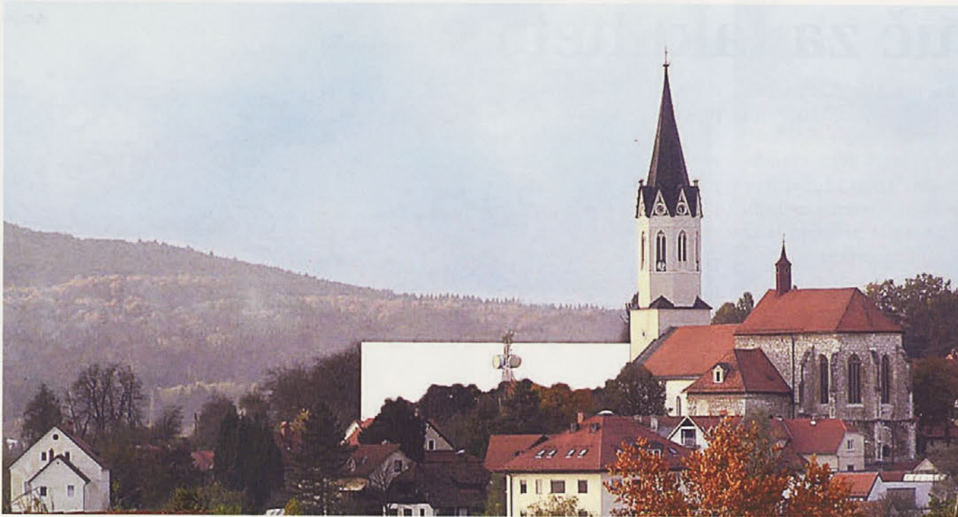
Celo pogled z Grma na staro mesto bi bil »prizadet«.