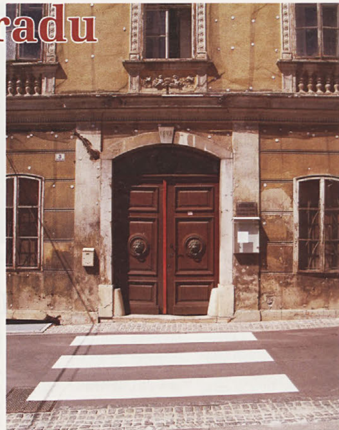
Prehod za pešce pred častljivimi vrati Narodnega doma, ki se sicer bolj redko odpro, je stalna grozeča nevarnost za obiskovalce starega hrama narodne zavesti.

»Narodni dom tak status zasluži, je pa res, da je pri njem zgodovinski vidik pomembnejši od arhitekturnega. Zavod mora pripraviti kakovostne strokovne pod- lage za razglasitev, ki bi prepričale komisijo. Predlog podpiše minister za kulturo, potem pa to potrdi vlada s sklepom.« Strokovne pod- lage za oceno na strokovni komisiji že pripravljajo na Območni enoti Zavoda za