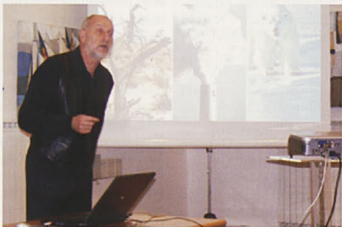
Profesor Plut je predstavitev podkrepil s številnimi ilustracijami in diagrami.