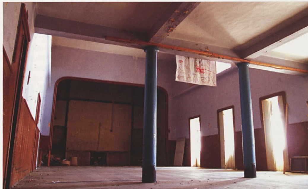
Dvorana v nekdanjem Narodnem, pozneje Sokolskem in celo v Domu JLA je bila vedno priljubljeno družabno zbirališče Novomeščanov.

»Rešitev za naložbo v Narodni dom vidimo v javno-zasebnem partnerstvu, vendar mora hiša ostati v lasti Mestne občine in služiti namenom, za katere je bila postavljena – se pravi kulturi in druženju. Če nam bo nakazana rešitev uspela, se bo premaknilo že v letu 2008.« Konservatorski program, ki na široko odpira možnosti