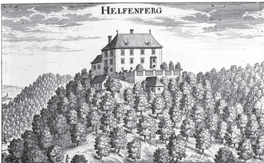
Slika 2: Graščina Helfenberg v Vischerjevi topografiji Štajerske.

predstavnik družine iz neposredne geografske bližine grofov, ki je že od leta 1340 sodila med celjske vazale. Leta 1414 Jošta sicer ne zasledimo med spremstvom grofa Hermana II. na evropsko pomembnem koncilu v Konstanci, 29 je pa v tem času že prisostvoval zadevam, ki so se tikale celjske hiše. 30 Služenje trem generacijam Celjskih Jošta jasno ločuje od njegovih prednikov, za katere nimam podatkov, da bi služili grofom drugače kot vazali, čeprav je res, da se je celjska uprava začela razvijati šele od druge polovice 14. stoletja naprej, jasno formo pa je dobila šele dobro generacijo po tistem, ko so Helfenberški postali vazali Celjskih. 31