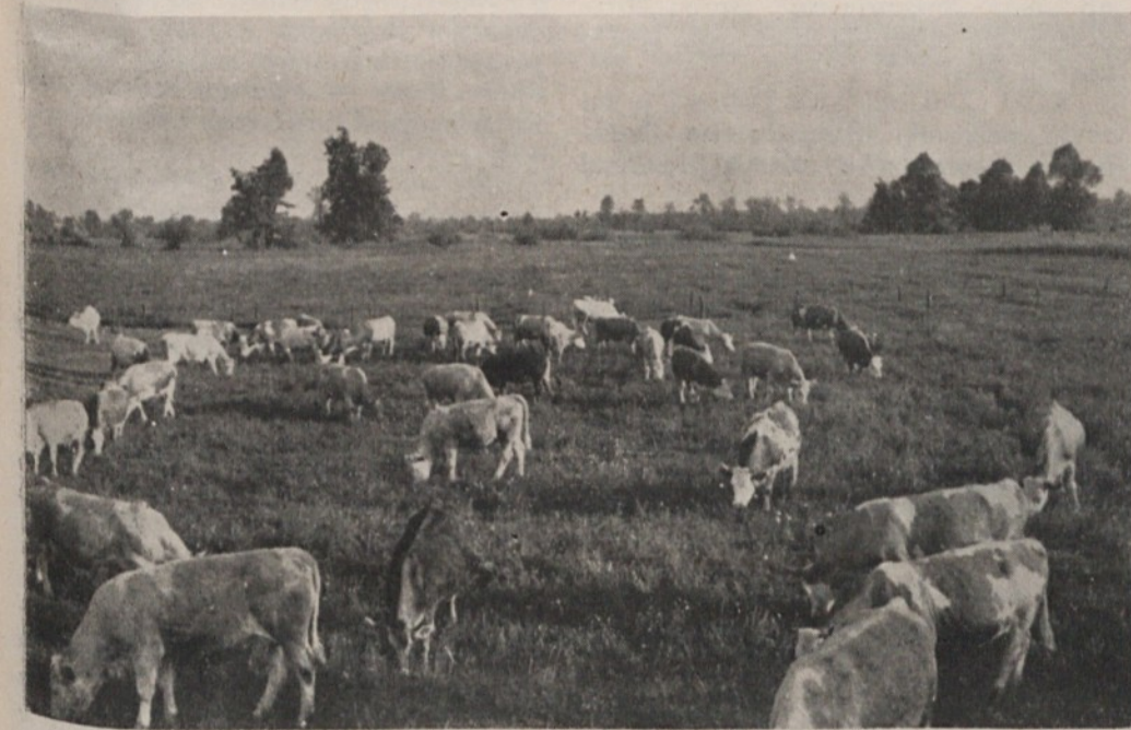
Nega travnikov, pogoj za dobro krmo

Uspeh posameznih ukrepov sloni na pravilno opravljenih predhodnih ukrepih, na primer zemljo bomo lahko raziskali le, če jo bomo pravilno osušili, gnojiti ima smisel le, če je zemlja že raziskana in razkisana.