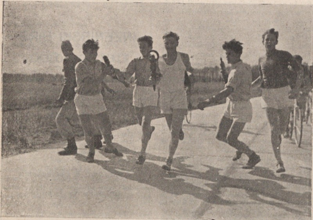
Štáfeto mladosti v čast 70. rojstnega dne maršala Tita so sprejeli in pozdravili tudi številni Vičani, zakaj njena pot je tekla tudi skozi občino Vič-Rudnik — Poslali smo maršalu Titu tople želje, da bi nas vodil in usmerjal še dolga leta v naši socialistični domovini