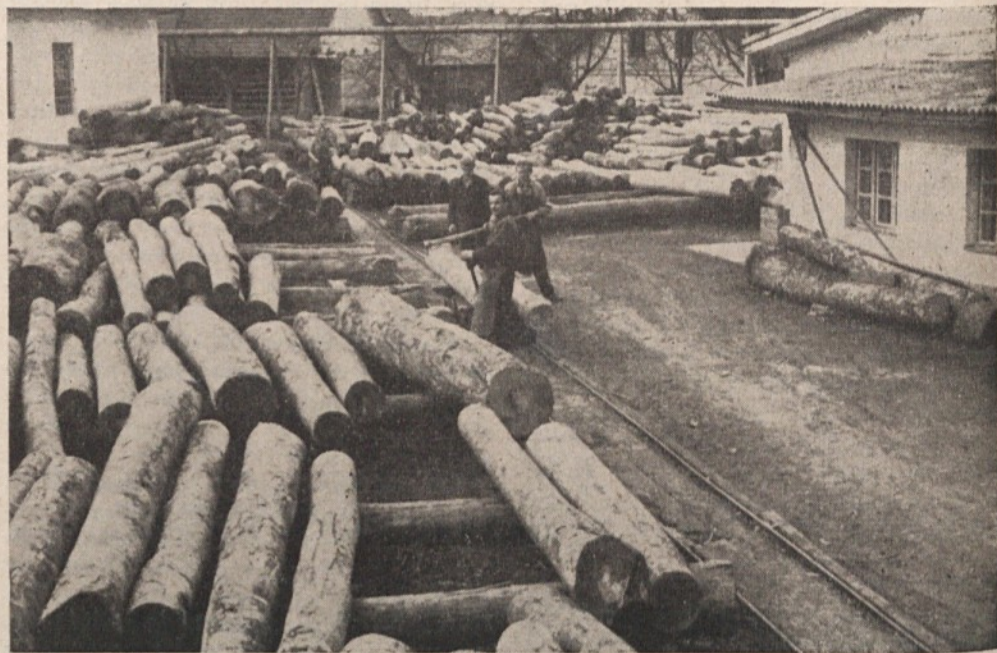
Takšno je delovno vzdušje v LPI Podpeč

veda na večji krog kupcev, teh pa pri nas doma tedaj ni bilo in jih tudi sedaj ni, zakaj naša proizvodnja je premočna za domače tržišče. Mi bi lahko v enem ali dveh mesecih naredili toliko obešalnikov, da bi zadostili celotnemu jugoslovanskemu tržišču. Torej smo morali iti na inozemsko tržišče. Da pa smo tam uspeli, so morali naši zastopniki potovati v tuje države in sprva ponu-