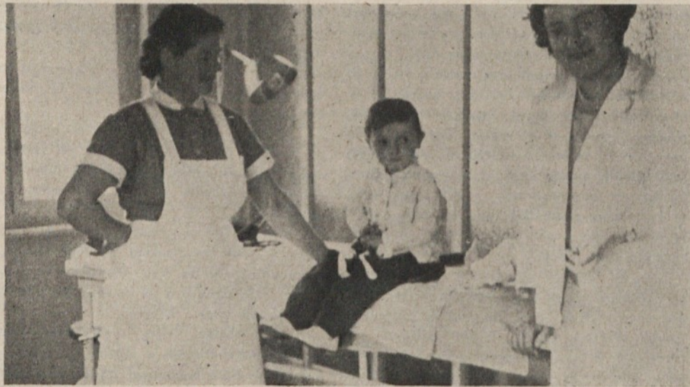
Mali pacient je tudi dobil pomoč v Zdravstvenem domu

Ob povečanju proizvodnje in asortimenta smo morali začeti misliti se-