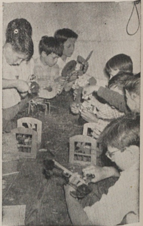
Velik interes za tehnično vzgojo

Temeljni zakon o financiranju šolstva iz leta 1950 je napravil velike spremembe v našem šolstvu. Sprožil je uveljavljanje procesa, ki se je v gospodarskih organizacijah začel z uvajanjem delavskega samoupravljanja. Solski odbori in kolektivi niso več samo izvajalci zakonov, navodil in ukrepov „višjega“