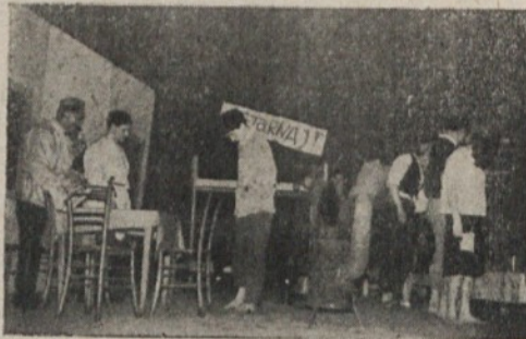
Makarenkova „Začenjamo živeti“ je izbrana za okrajno revijo — Izvaja KUD „France Prešeren“ Trnovo

na odru veliki konflikt med starim in novim — propadajoče, trhlo, zločinsko in napuha polno gruntarstvo ter mlada, neustrašna, pogumna, lahko bi rekli proletarska „samorastniška“ žvot. — Zmaga močnejši. Toda moč ima tisti, ki ima „roke, ki znajo delati“.