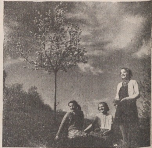
Prišel je zeleni Jurij in z njim zaželena pomlad

Vsa predvidena sredstva, tako za stanovanjske zadrge, kakor za individualne graditelje in prodajo stanovanj bodo razpisana potom natečaja.