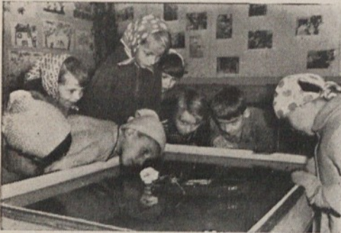
V varstveni ustanovi Rožna dolina

Sklad je imel v času obstoja sklada 6.037.255 din dohodkov in 3.387.267 din izdatkov. Ta sredstva so bila porabljena na podlagi pravil sklada in finančnega načrta samo za adaptacijo in delni odkup stavbe v Logu pod Mangartom. To zgradbo občina uporablja že od leta 1959 naprej za letovanje zdravstveno in socialno ogroženih otrok naše občine. Porabljena sredstva sklada so se trošila na