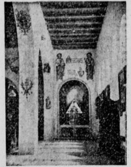
»Katoliška ladja z oltarjem sv. Trojice.