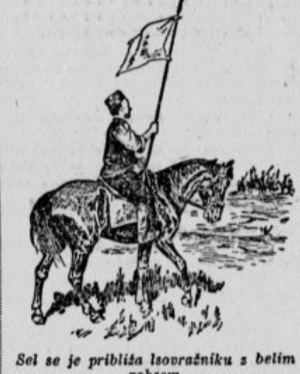
Sei se je približal sovražniku s belim robcem

Drugi dan smo, hvala Bogu, srečno dospeli v Arhangel'sk. Bilo je 18. julija. Potovali smo 1 leto, 3 mesece in 3 dni.