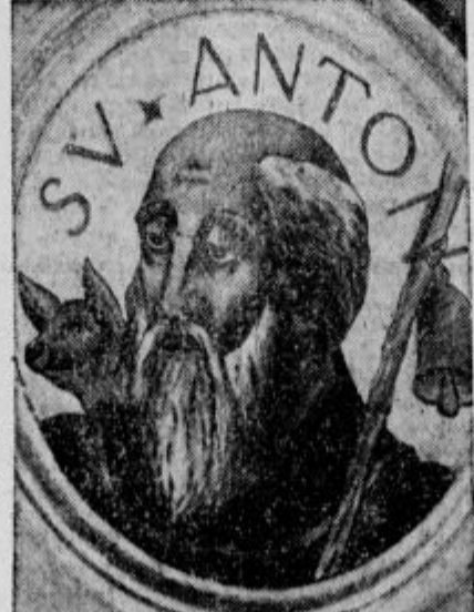
Freske sv. Antona v cerkvi v Knežaku.