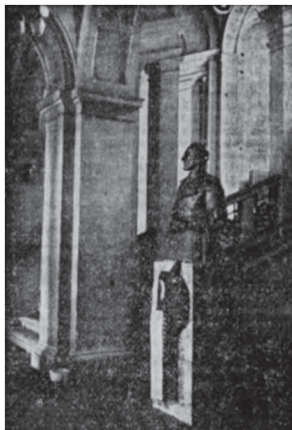
Slika 4: Spomenik kralju Aleksandru v univerzitetni avli.

Fig. 4: The memorial commemorating King Alexander in the lobby of the university building.