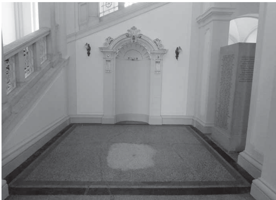
Slika 1: Osrednji del univerzitetne avle z nišo, v kateri je stal kip kralja Petra.

zem Stanisława Jerzyja Leca: »Ko rušite spomenike, ohranite podstavke, vedno jih lahko znova koristno uporabite.« Ker je bilo doprsje premično, so ga ob nekaterih svečanih priložnostih uporabili kot slavnostno dekoracijo in ga prenesli v veliko dvorano univerze, npr. ob medzavezniškem invalidskem kongresu septembra 1922. 13 Kot bo še omenjeno, so v avli leta 1936 postavili kip kralja Aleksandra, zato so takrat »majhen, a lep spomeniček« njegovega očeta prestavili v rektorjevo sobo. 14 Zanimivo je, da so takrat v tisku trdili, da je Petrov kip univerzi podaril prav kralj Aleksander, 15 kar pa je vprašljivo, saj bi časnikarji ta podatek predhodno gotovo posebej omenili. Petrov doprsni kip je najstarejši do zdaj dokumentirani spomenik pripadniku dinastije Karadorđević na Slovenskem.