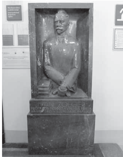
Slika 2: Žolgerjev spomenik.

Pripravljalni odbor se je za pomoč posebej zahvalil prof. Jožetu Plečniku, »ki je vse svoje veliko umetniško izkustvo vedno dal z dragocenimi nasveti odboru na razpolago«, »izraz posebne zahvale« pa je bil namenjen tudi avtorju spomenika, kiparju in slikarju Tonetu Kralju, ki je bolj kot po javnih spomenikih znan po svojih monumentalnih slikah s prizori iz družinskega in kmečkega življenja, cerkvenih freskah in knjižnih ilustracijah. 30 »Naj bo torej spomenik tudi zunanji znak čustev ljubezni in spoštovanja, ki ga goji univerza in naš narod do Ivana Žolgerja«, je sklenil odbor. 31