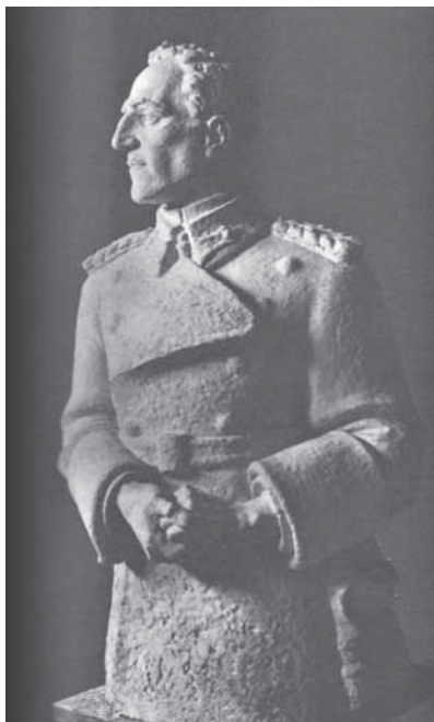
Slika 3: Kip kralja Aleksandra, delo Nikolaja Pirnata. Fig. 3: The sculpture depicting King Alexander by Nikolaj Pirnat.

je nekaj v meni prelomilo. Ta lik Viteškega kralja Aleksandra I. Uedinitelja pa sem v resnici končal z občutkom nekakšnega vedrega zadoščenja.« 51