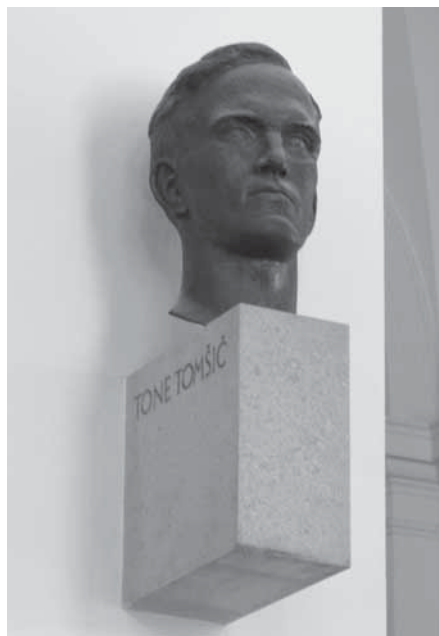
Slika 7: Kip Toneta Tomšiča.

Fig. 6: The sculpture depicting Boris Kidrič.