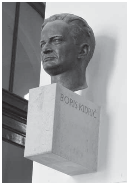
Slika 6: Kip Borisa Kidriča.

Avtor kipov je akademski kipar Boris Kalin (na vratu obeh kipov je vrezana njegova signatura B. KALIN ), ki je v svojem obsežnem opusu spomeniške plastike izdelal tudi vrsto slovenskih spomenikov narodnoosvobodilnemu boju. Oba revolucionarja, ki ju je izdelal za univerzo, je upodobil večkrat. Že leta 1957 je izdelal celopostavno Tomšičevo figuro, ki je bila postavljena pred istoimensko ljubljansko osnovno šolo ob Zemljemski ulici, odlitka Tomšičevega doprsnega kipa z univerze pa sta (bila) na ogled še v nekdanji šentviški vojašnici in velenjskem muzeju.