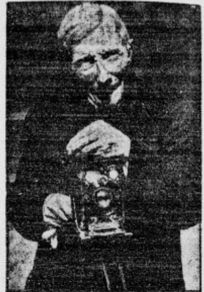
Ameriški petrolejski kralj in militarder Rockefeller je nedavno umrl star 98 let. Večino svojega premoženja je zapustil v dobrodelne namene.

d Najnižje dopustne mezde (minimalne) v vardarski banovini je določil tamošnji ban, in sicer: v krajih z manj ko 5000 prebivalci na din 1,80, za nekvalificirane delavce izpod