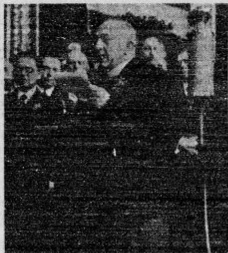
Dr. Anton Korošec govori na proslavi 20 letnice majske deklaracije v Ljubljani.

Večina našega liberalnega in socialističnega svobodnjakarstva se je ob 20 letnici majniške deklaracije s svojim ponašanjem in pisanjem po svoji prosti volji izključila iz slovenskih vrst tudi za čase, ki pridejo.