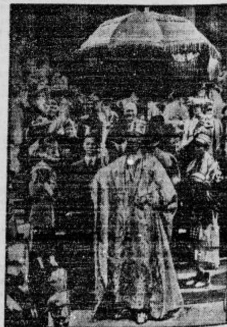
Pri kronanju angleškega kralja je zbujal posebno pozornost samorski poglavar iz Afrike, ki je kot povabljenec v svojih čudnih oblačilih prisostvoval svečanostim.