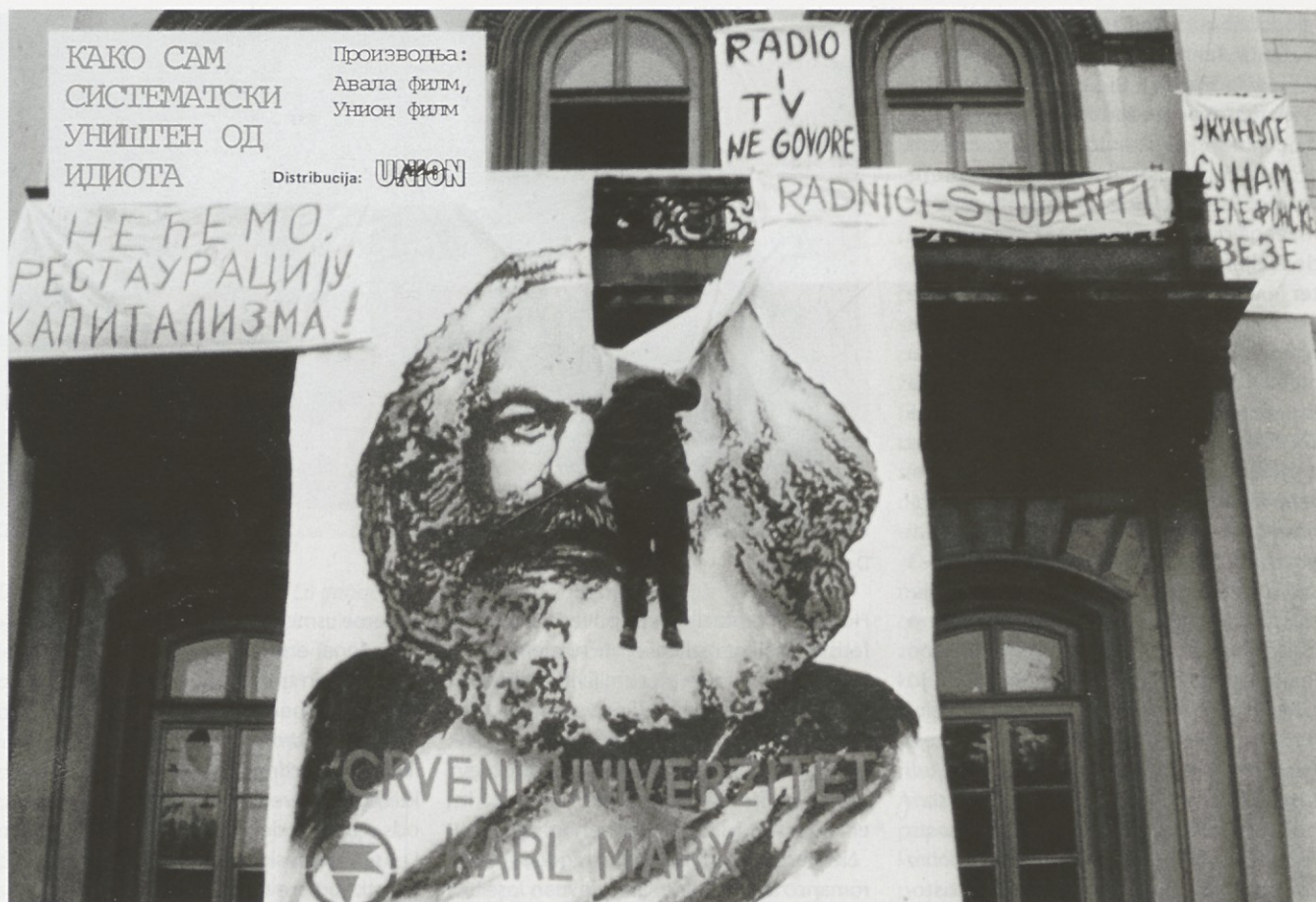
Kako so me idioti sistematično uničili