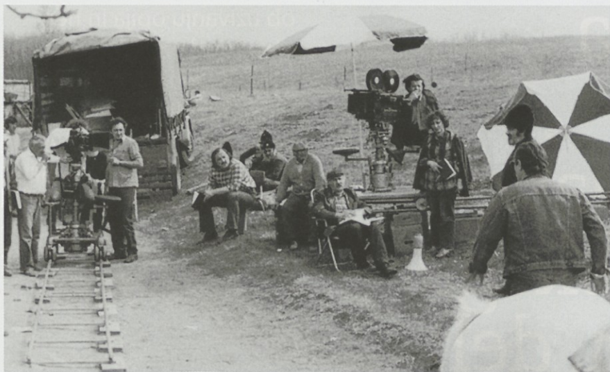
Šijan na snemanju filma