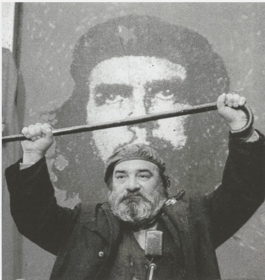
Kako so me idioti sistematično uničili