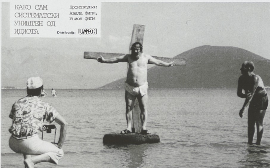
Kako so me idioti sistematično uničili