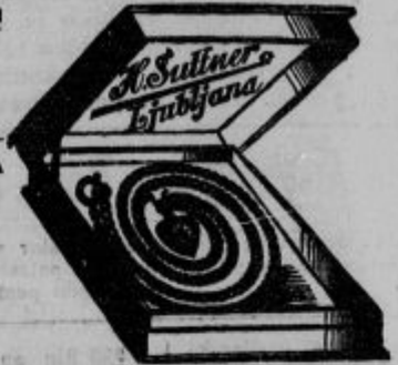
Srebrne vratne verižice (Collier) od Din 30.— naprej Zlate vratne verižice (Collier) od Din 85.— naprej