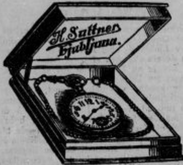
Ure za dečke od Din 44.— naprej.