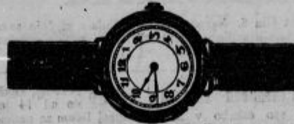
Zaprte ure, srebrne od Din 152.— naprej. 14 karat zlato od Din 296.— naprej.

PRESERNOVA ULICA 4 — POLEG FRANCISKANSKE CERKVE — NAJVEČJA ZALOGA UR, ZLATNINE IN SREBRNINE. — LASTNA TOVARNA UR V SVICI