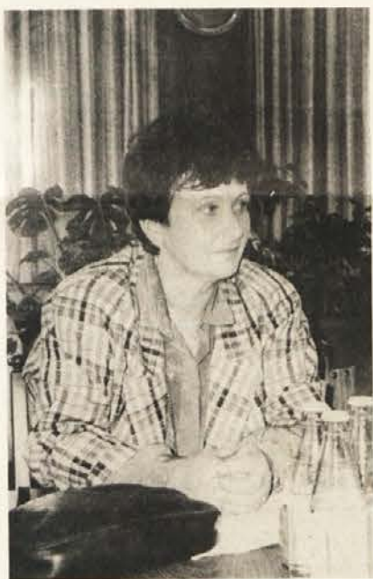
Ministrica za pouk dr. Hilda Hawlicek