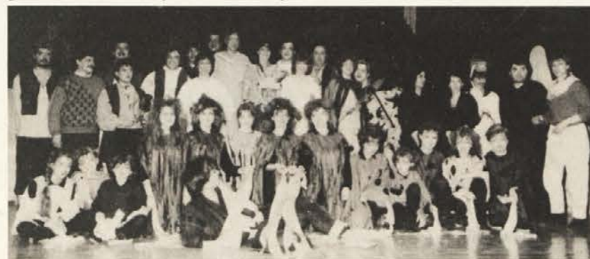
Igralci SPD „Zarja“ na uspešni premieri

zahtevnemu tekstu pripomogla do uspele odrske uprizoritve. Poldej Zunder je gledališki delavec, ki skuša