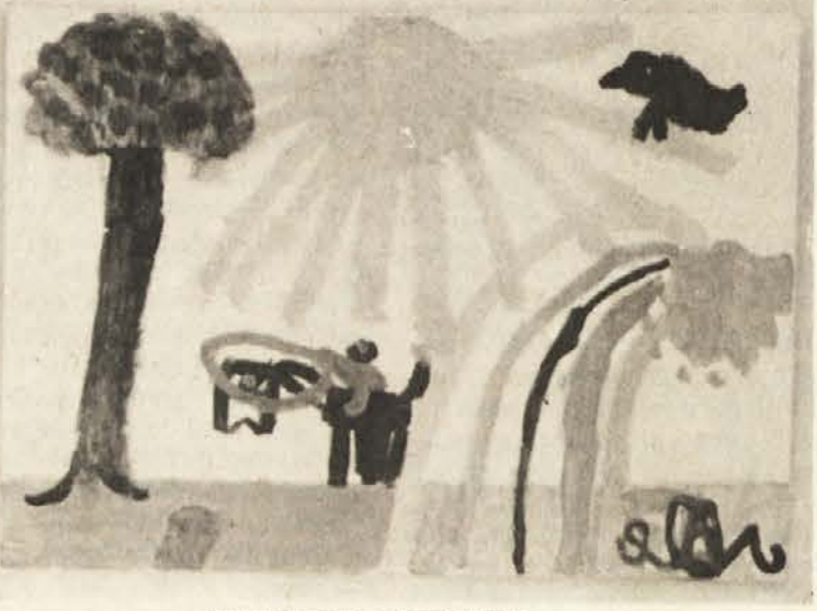
Posnetek iz razstave otroških risb