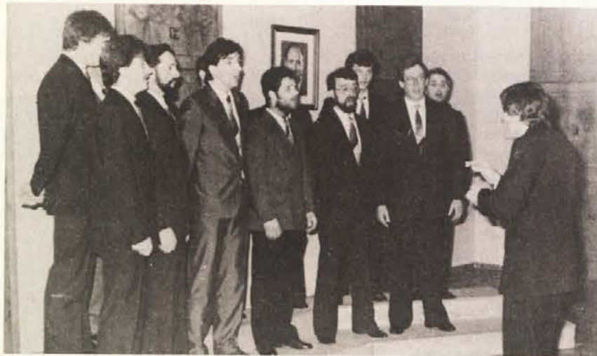
Moški zbor (zgoraj) in otroška skupina (spodaj).