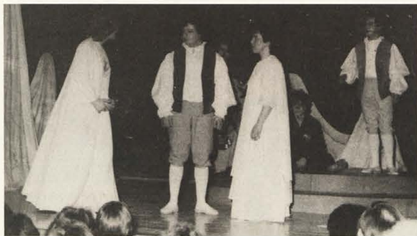
Prizor iz komedije „Sen kresne noči“

svojem bistvu. Saj: „Najboljše v tej stroki so zgolj sence, in najslabše ni slabše, če domišljija spopolni.“ Igralska skupina iz Železne Kaple je