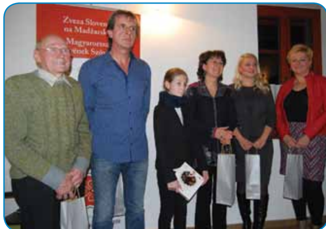
Obujamo dedišöino v Porabju - pravljilöni veöeri na Gornjem Seniku

Na dnevu sploönih knjiönic je soboöka Pokrajinska in ötudijska knjiöznica prejela nagrado za najboljöi projekt sploönih knjiönic