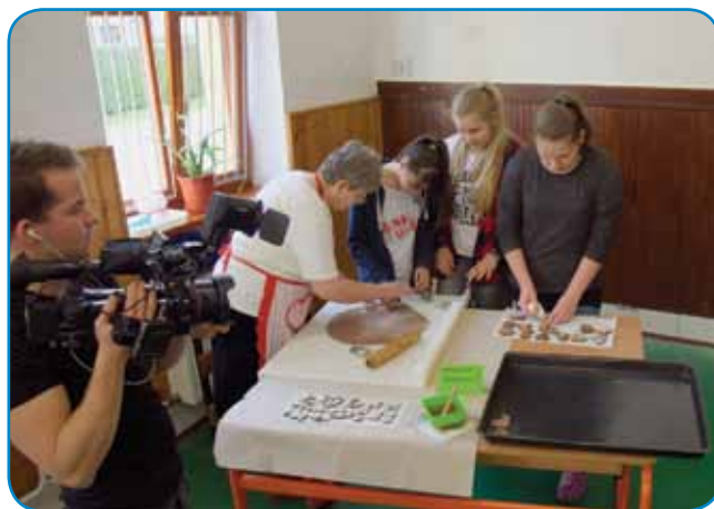
Otroci so pekli tudi medenjake

smo ji poleg šolske kuhinje prikazali sklop dejavnosti s poudarkom na obšolskih dejavnostih in življenju nekoč v teh krajih. Vse dogajanje je potekalo sočasno: učenci so plesali (venček porabskih plesov), peli porabske pesmi, igrali (prizor »Betlehmeške«), pekli medenjake (mézeskalács), izrezovali božične motive (Miklavže in jelene) in pripravljali