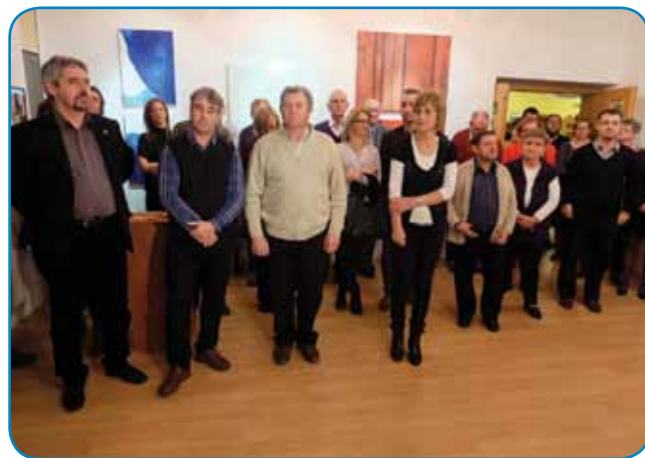
Del obiskovalcev na otvoritvi razstave iz stvaritev, nastalih na letošnji 16. Mednarodni likovni koloniji

v muzejske namene. Opozoril je tudi na možnost črpanja evropskih sredstev in pozval k boljši povezanosti s kolonijami v Lendavi, na Madžarskem ali celo na Slovaškem. »Moja želja je bila zmeraj, da bi mladega strokovnjaka na sedežu Zveze Slovencev finančno podprla sama država ali občina Monošter. Šele takrat se lahko pogovarjamo naprej o tem, kako prodreti v