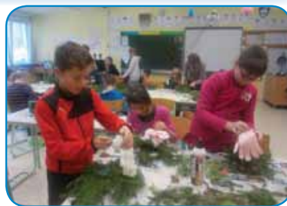
6. razred je pletel adventne vence

5. razred je najprej iz plastičnih steklenič delal škornje za Miklavža. Najprej smo razrezali steklenico in jo zalepili. Potem smo nanjo nalepili papirje. Zadnja naloga je ostala nedokončana, saj bi še morali pobarvati na rdeče, ampak se je barva prepočasi sušila.