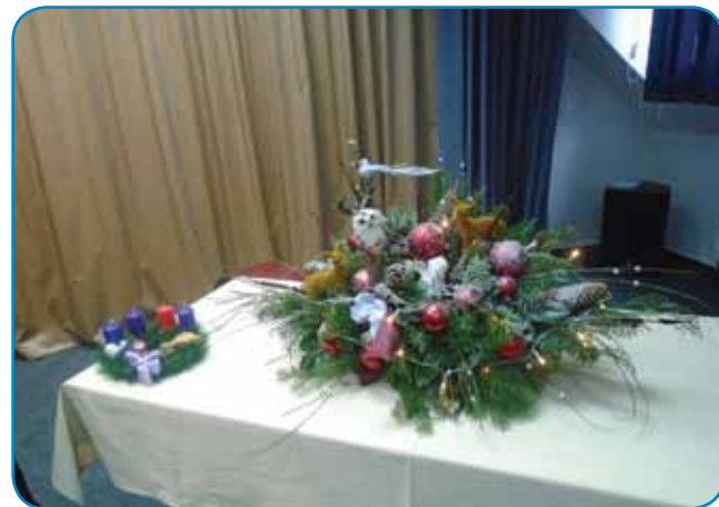
V delavnici so se pripravili adventni vejnci pa lejpi okraši

Na konci pa aj na velko na znanje dam tista lejpa miš-