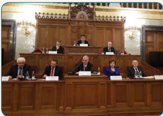
»NARODNI SKUPNOSTI POVEZUJETA DRŽAVI« stran 3