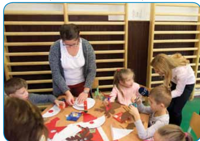
Najmlajši so izrezovali Miklavže in jelene iz papirja