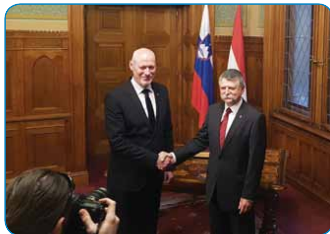
Predsednik madžarskega Parlamenta László Kóvér in Državni zbor RS Milan Brglez in uradni obisk.

Naslednji dan uradnega obiska se je začel s konferenco