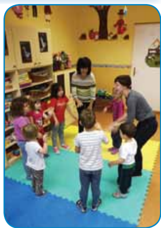
Pa še zaplesali smo

Za zaključek pa smo se igrali igro vlog zdravnik in bolnik, kjer smo otroke spodbujali k uporabi vljudnostnih izrazov in h kratkemu dialogu. Zdravnik in bolnik sta se najprej