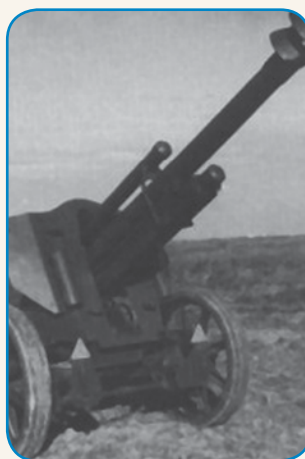
GRANATE, GOLAUBIŠKE ... stran 8