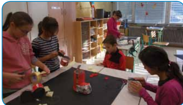
Učenci 5. razreda so delali škornje

Po malici smo sestavili zelo zanimiv okrasek: snežaka iz različnih materialov, ki so si ga naši učenci lahko odnesli domov. Z učenci šestega razreda