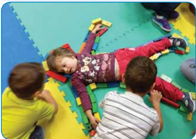
Učimo se dele telesa

(glava, oči, nos, usta, ušesa, lasje, trebuh, roke, noge).