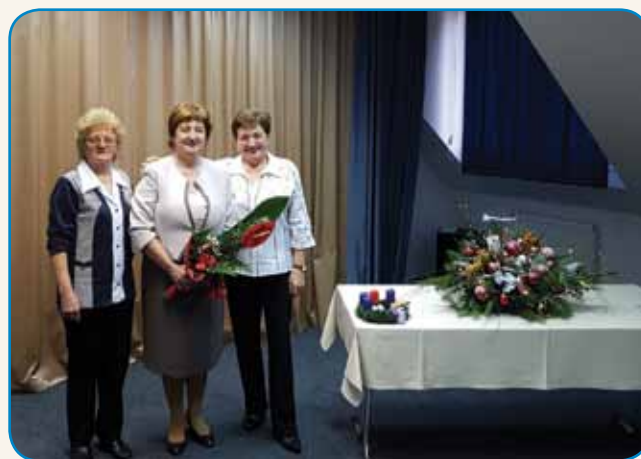
»ADVENT JE ČAS PRIČAKOVANJA ...« stran 10