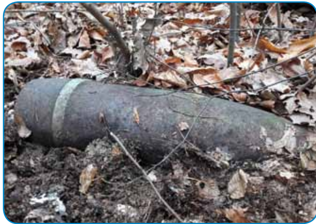
Tak je bomba ležala v andovskoj gauštji

ezermešter bejo, vse vruga je znau napraviti. Te dinamo, ka je on nam napravo, je tō v nemškem tanki bijo, plavo barvo ma, tak ka leko, ka z ednoga Tigriš tanka je bijo vōpobran. Zdaj nejdavnik je