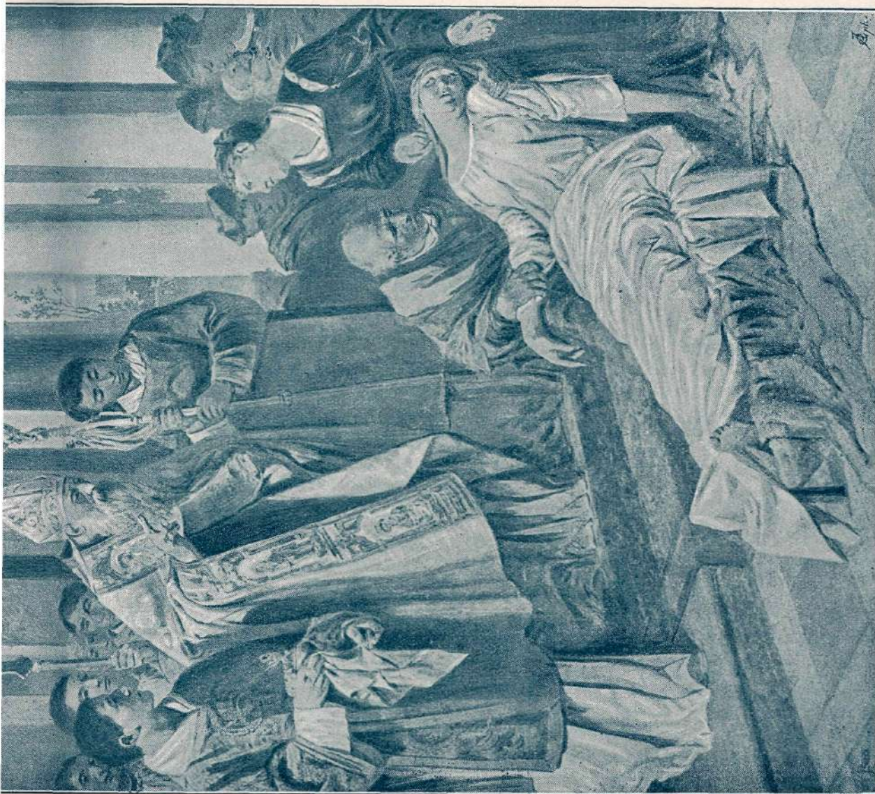
Janeza Šubica „Sv. Martin“ v šmartinski cerkvi pod Šmarno Goro. (Po fotografiji.)

»Zbežala je, predno ste stopili v grad«, ponovi hlapec.