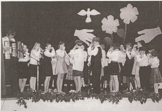
Otroška folklorna skupina je vadila komaj en mesec, a oder je bil njihov, navdušenje občinstva pa prav tako

Občinstvo so najprej pozdravili ubrani glasovi MPZ Lončar, potem pa sta besedo prevzela in vodila program napovedovalca Melita in Tomaž in med programom prebirala misli o prijateljstvu. To prepotrebno vrednoto smo si namreč izbrali za nosilno temo letošnje prireditve. Sodelovalo je kar 74 otrok, kot učenci osnovne šole in kot pevci cerkvenega in šolskega zborčka.